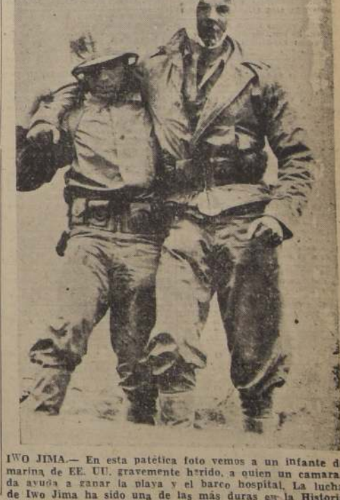
IWO JIMA.— En esta patética foto vemos a un infante de marina de EE. UU. gravemente herido, a quien un camarada ayuda a sanar la plaga y el barco hospital. La lucha de Iwo Jima ha sido una de las más duras en la Historia.