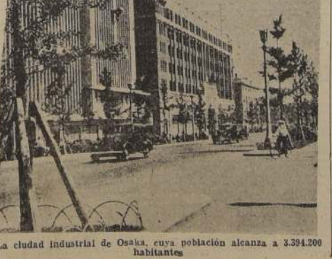
La ciudad industrial de Osaka, cuya población alcanza a 3.394.200 habitantes.

Las Superfortalezas con bases en las Marianas desahogaron solo un día después del terrible ataque a Tokio antes de la incursión contra Nagoya el domingo, y aparentemente un número idéntico de aviones intervino en el ataque a Osaka. Este ha sido el período más activo hasta ahora en la guerra aérea del Pacífico.