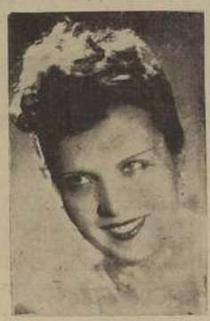
MIRTHA LEGRAND EN "LA CASTA SUSANA"

Ayer tuvimos la oportunidad de entrevistar a la artista Franca Boni, primera figura del conjunto de Operetas que con tanto éxito, está actuando en el Municipal. Nos manifestó en primer término que esta comparsa del conjunto de Operetas que con tanto éxito, está actuando en el Municipal, es una gran oportunidad para el público que esto no se le repita en su vida. Agregó que en su anterior visita a Chile, pudo apreciar este mismo favor que ahora se le dispensa. Franca Boni es italiana y durante varios años actuó en diversos países en el mismo género que hoy con tanta maestría y gracia delicia el público de nuestro primer Coliseo. Nos refiere que ha sentido mucho no haber podido interpretar con mayor brillo "Vivida Alegre" opereta que se de su producción, debido a un pequeño accidente de salud que le impidió desarrollar sus méritos vocales en plenitud. Nuestra simpática entrevistada nos hace un vivo y detallado relato de su vida, manifestando que en este Continente el género de operetas y zarzuelas es de una enorme aceptación. Ella, acostumbrada a actuar en el teatro de su país, en el teatro de los Estados Unidos, y en realidad la crítica europea y americana ha sido con ella, totalmente unánime en considerar a una figura de relieve en la Opereta.