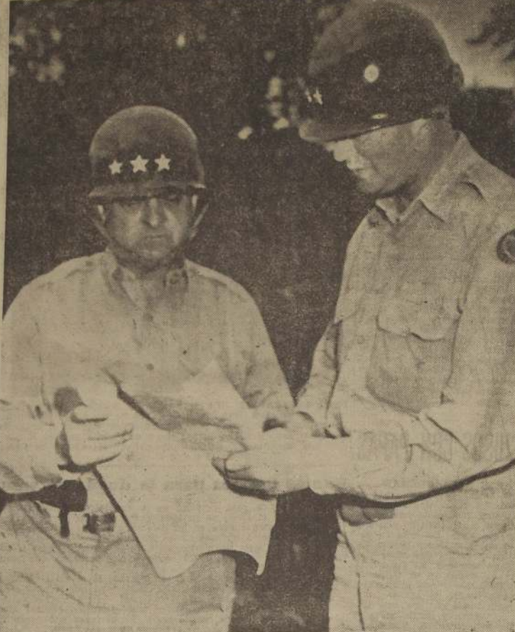
SEUL, Corea.—El teniente general, Walton H. Walker, comandante del Octavo Ejército Norteamericano en Corea, resultó trágicamente muerto cuando el jeep en que viajaba patinó y cayó encima de él. El general murió camino del Hospital de emergencia, el 23 de diciembre. Aquí conferencia con el mayor general William Dean, quien desapareció en la primera etapa de la guerra coreana, dándosele por muerto.

La policía ha estado custodiando la piedra desde la noche del robo, de 393 libras, después de forzar la puerta de la Abadía, probablemente se atribuya a un movimiento que existiera en la corona británica.