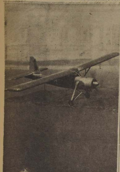
AVION TAXI Y TRANSPORTE. — El nuevo avión británico Prestwick Pioneer, fabricado por la Scottish Aviation, con motor de 1000 caballos, puede ser utilizado como avión taxi, como transporte de carga y otros usos domésticos. Aterriza fácilmente en pequeñas canchales y es un monoplano de alta ala. — (Foto BIPPA).