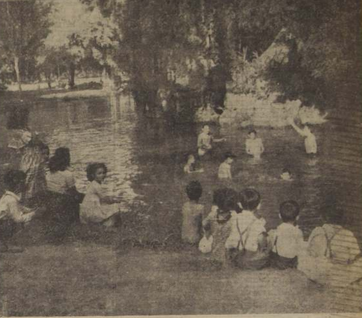
29,5 GRADOS A LA SOMBRA. El día de ayer fue caluroso y el termómetro marcó una temperatura máxima de 29,5 grados a la sombra. Los niños no pudieron resistir la tentación de jugar en las aguas de la laguna del Parque Cousiño. Los guardas los ahuyentaron en diversas ocasiones, defendiendo la reciente siembra de alevines de pejerreyes argentinos. Pero los pequeños, apenas desaparecieron los guardadores del centenario paseo, volvieron a sumergirse en las frescas aguas de la idílica laguna. LA NACION presenta un juvenil grupo a sus lectores, mientras en la orilla observan una madre y los menos audaces.

Hoy a las 10 horas, se iniciará en la Moneda un Consejo de Gabinete, presidido por el Excmo. señor Gabriel González. Se tratará, principalmente, del proyecto sobre coordinación del crédito para orientarlo especialmente hacia la producción.