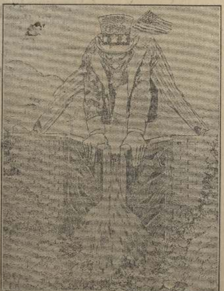
El Tío Sam abriendo la primera esclusa. (Caricatura de "Noticias" de Lima.)