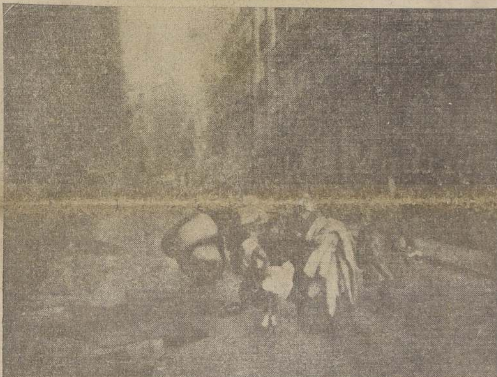
Una de las numerosas e impresionantes escenas de la evacuación de la capital española