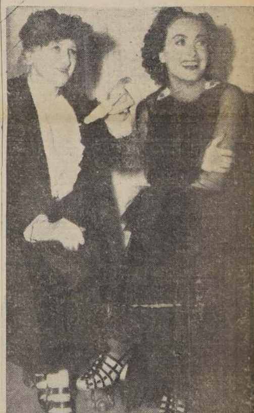
Mary Garden visita a Joan Crawford en los estudios Metro Goldwyn Mayer durante la producción de una nueva película de que Joan es estrella