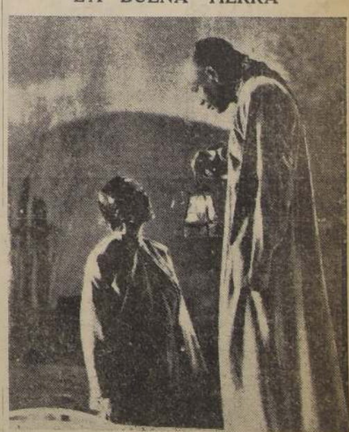
Paul Muni y Louise Rainer, dos astros de la Metro Goldwyn Mayer, en la nueva gran producción, titulada "La Buena Tierra", y que será una de las películas más importantes de la próxima temporada cinematográfica. Esta cinta está inspirada en un episodio dramático que ocurre en China en la época de la revolución que abatió a ese Imperio.