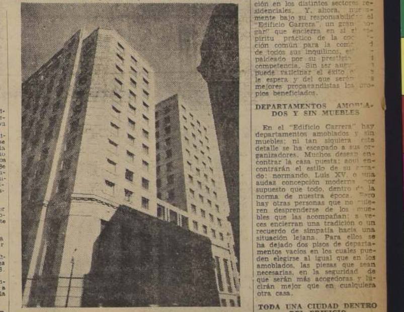
Un aspecto del imponente "Edificio Carrera", Agustinas esquina Morandé, visto por el costado de Agustinas

Fue en 1936, cuando comenzó a levantarse, junto al Ministerio de Hacienda, un edificio de grandes proporciones. Las murallas subían rápidamente, combatiendo el cerco de grandes