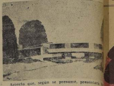
Aspecto que, según se presume, presentará la mañana.

El transporte actual es, en ge- neral, sumamente cómodo y rá- pido; el hogar no se mide en ki- lómetros, sino en cientos de ki- lómetros. Las comunicaciones son rápidas que el transporte.