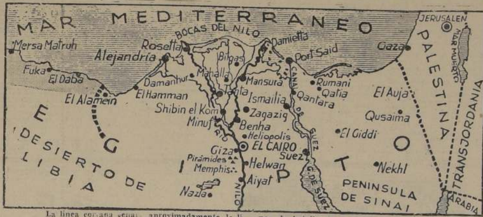
La línea con una señal aproximadamente, la línea de batalla en el frente de El Alamein

Se produjo esta desordenada retirada del Eje después de un