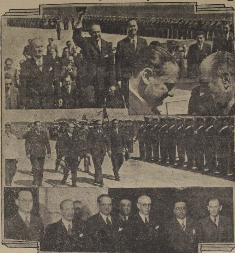
Un cordial recibimiento se tributó al Excmo. señor Caracciolo Parra Pérez a su llegada a Los Cerrillos.—El mosaico muestra diversos aspectos de la recepción de que fué objeto.