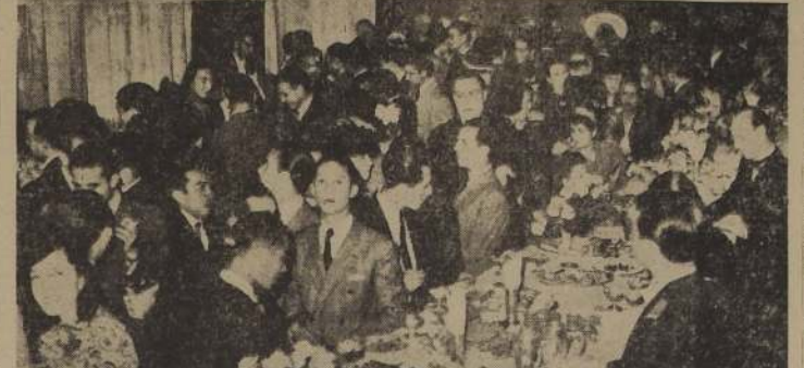
La colonia venezolana en los salones del Hotel Carrera, donde fue recibida ayer por el Canciller de Venezuela, Excmo. señor C. Parra Pérez, con motivo de su arribo al país.