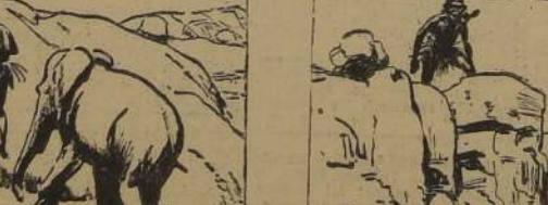
PARALELAMENTE KEYDO SE DESMONTA, ASCENDIENDO A LA PARTE MAS ALTA DEL BARRANCO. EL ELEFANTE LE SIGUE.