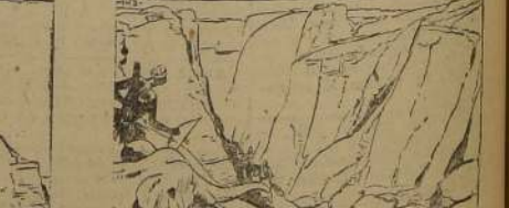
AL ASOMARSE POR EL BORDE DEL PEÑON PUDO VER COMO... TARZAN Y SUS ENEMIGOS PENETRABAN EN EL VALLE. KEYDO SE PREPARA PARA ENTRAR EN ACCION.