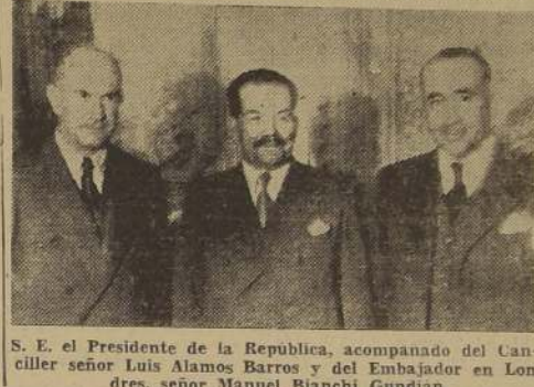
S. E. el Presidente de la República, acompañado del Canciller señor Luis Alamos Barros y del Embajador en Londres, señor Manuel Bianchi Gudián.

El ex Ministro de Relaciones Exteriores, don Manuel Bianchi Gudián, concurrirá hoy y mañana a las Comisiones de Relaciones de la Cámara de Diputados y del Senado, respectivamente, dar cuenta de las diversas actividades que desarrolló mientras estuvo a cargo de la Cancillería.