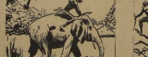
FOTO ATRAVESÓ LA LLANURA CON KEYDO, AL LOMO, EL PROPOSITO DEL MUJACHO ES SALVAR A TARZAN.