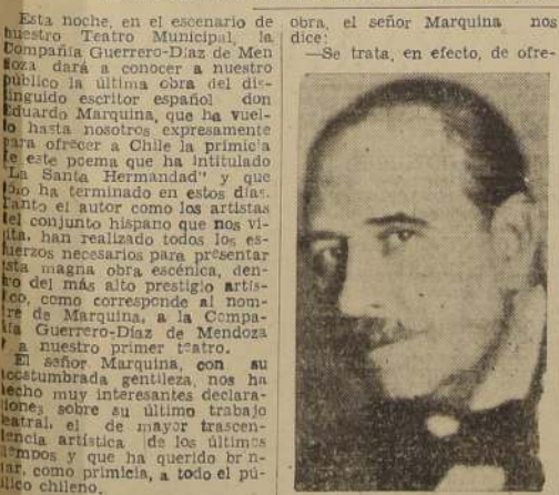
El dramaturgo E. Marquina, que estrena esta noche su obra "La Santa Hermandad".

EL ILUSTRE DRAMATURGO ESPAÑOL NOS HACE INTERESANTES DECLARACIONES SOBRE SU OBRA.—SALUDA, POR NUESTRO INTERMEDIO, AL PUBLICO DE SANTIAGO, Y AGRADECE LAS GENTILEZAS RECIBIDAS EN NUESTRO PAIS.—OFRECE A CHILE LA PRIMICIA DE SU OBRA RECIENTEMENTE TERMINADA.