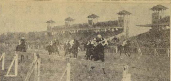
CHEVALIER PHILIPPE, con Ricardo Maturana arriba, hace suyo de manera bastante fácil el clásico "Nicolas Barros Luco". Segundo, a dos y medio cuerpos termina Idem, delante del favorito Tarrerito, Don Joropo e Incógnita.

Primer Domingo 27. Se entregó para su publicación la boleta ganadora del último Concurso de Pronósticos. Seis primeros y un segundo acertó la boleta ganadora del último Concurso de Pronósticos. Se entregó para su publicación la boleta ganadora del último Concurso de Pronósticos. Seis primeros y un segundo acertó la boleta ganadora del último Concurso de Pronósticos.