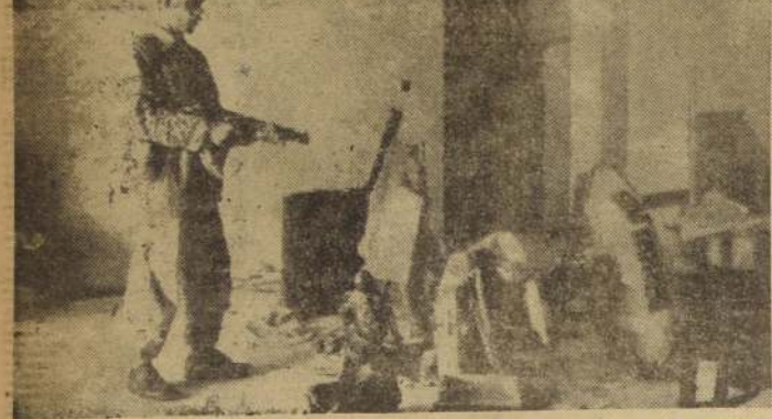
BAGDAD.— Un soldado del nuevo régimen de Irak monta guardia el 20 de julio en la Sala de recibes del Palacio Real, residencia de Nuri al-Said.