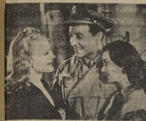
Vivien Leigh y Robert Taylor, frente a Virginia Field, en una de las escenas de "El Puente de Waterloo", la gran película Metro Goldwyn Mayer que estrenará el próximo viernes el Teatro Metro

"El Puente de Waterloo" dramatizado por Vivien Leigh, es su primera película después de "Lo que el viento se llevó"