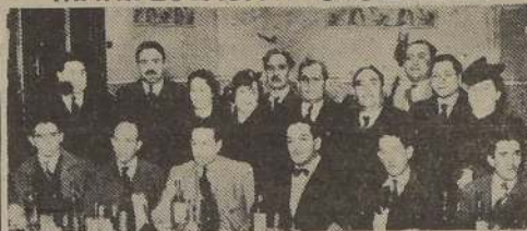
Parte de los asistentes a la manifestación con que clausuró sus labores la Convención de Instituciones Sociales no vinculadas a orientaciones políticas

La Federación Industrial de Obreros Metalúrgicos de Chile convoca a asamblea ordinaria de delegados permanentes, para hoy, a las 20 horas, en su local social, calle Moneda 2460.