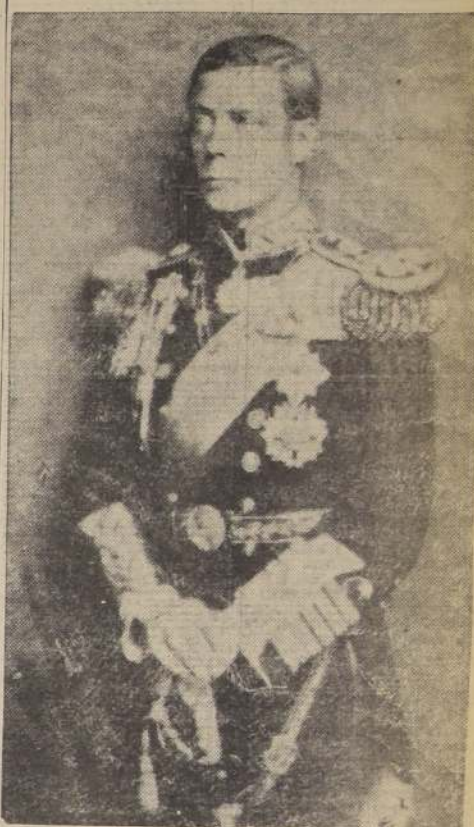
S. M. EDUARDO VIII

Se le ordenó volver al asiento de los testigos y dar explicaciones al juez, pues de lo contrario sería encarcelado por desprecio al tribunal. Mahon dio explicaciones.