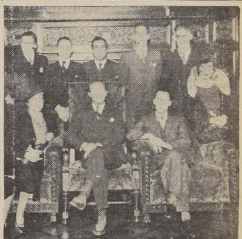
Asistentes a la reunión ofrecida a la prensa de Santiago, por el violoncelista Feuermann, en los salones del Crillon.