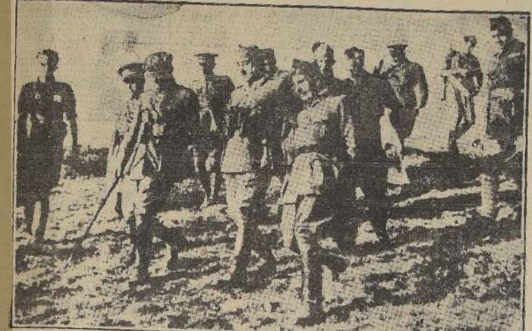
El general Franco, acompañado por el coronel Vigón y otros miembros de su Estado Mayor, se dirige a Santander, después que la ciudad cayó en poder de los nacionalistas.