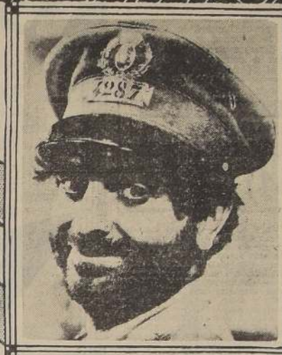
PRODUCCION "RIO DE LA PLATA" Distribución: BARTO TERRASA

CENSURA Sólo PARA MAYORES; no recomendable para señoras.