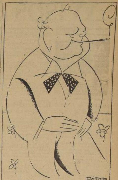
Winston Churchill, visto por Romera

Justa la Doctrina. Dr. a cada cual lo suyo. Alivia las cargas