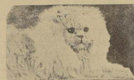
"Margay", Maharaja de Brasil o gato de los bosques

La exposición anual del "Club de Gatos", que ha tenido lugar en París ha permitido constatar el desarrollo que ha alcanzado la cría y selección de gatos de raza. Las razas se han clasificado en: razas de pelos largos y razas de pelos cortos.