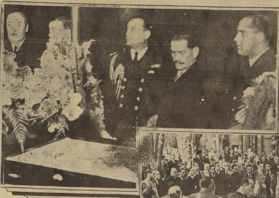
S. E. durante su visita a la Capilla ardiente.

He cumplido esta triste misión: y quiero unir, a la manifestación de la producción en la región que representaba y, en general, a la expansión económica del país.