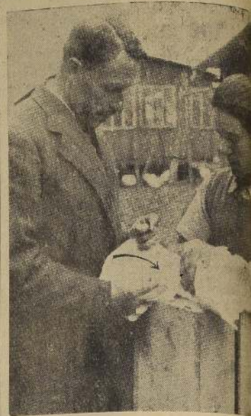
Después de clavar, se coloca el tubo de modo que que sale de la vena. El operador puede verificar el número de orden, ya que el ave lo lleva signado en la circunda la pierna.