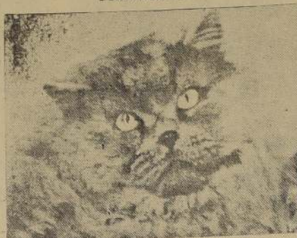
"Laughton Barley Boy", de raza persa