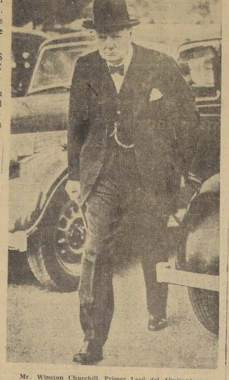
Mr. Winston Churchill, Primer Lord del Almirantazgo