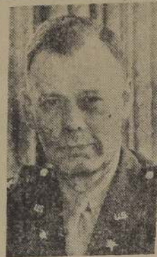
Mr. William Bedell Smith, Embajador de Estados Unidos en Moscú

WASHINGTON, 11. (U. P.). — El comité de actividades antinorteamericanas de la Cámara de Representantes, pidió al Departamento de Justicia, que iniciara una inmediata persecución al partido comunista por ser una "amenaza" a la seguridad nacional. Declaró que ese partido propugna el derrocamiento del Gobierno "por la fuerza y la violencia", y advirtió que "lo que los comunistas chinos o griegos están haciendo hoy, es lo que los comunistas norteamericanos harían mañana en semejantes circunstancias".