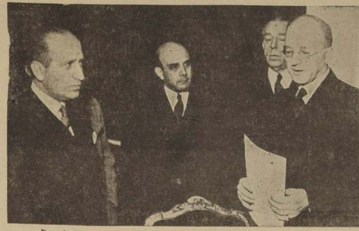
Durante la ceremonia de la firma del Tratado Provisional con Gran Bretaña

ES LA BASE DE UN ENTENDIMIENTO DEFINITIVO