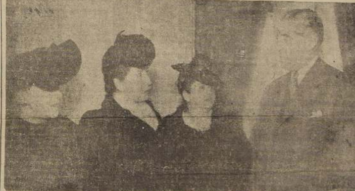
La comisión de damas se entrevista con S. E.

COMITE DE DAMAS SOLICITO DESIGNACION DE MINISTRO EN VISITA AL EXCMO. SR. RIOS Y AL PRESIDENTE DE LA CORTE SUPREMA.—OFICIO DEL MINISTRO DE JUSTICIA SE TRATARA HOY EN EL PLENO DE LA SUPREMA.—OTRAS NOTICIAS CON RELACION A ESTE SENSACIONAL CRIMEN