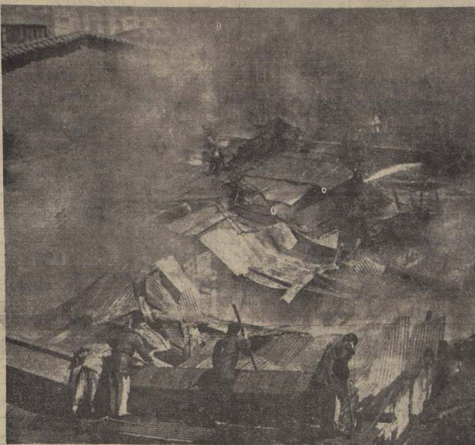
CUATRO GALLINAS CAUSARON ESTE SINIESTRO.— La fotografía muestra en toda su magnitud el siniestro de la mañana de ayer en Merced, donde cuatro gallinas que volcaron un brasero provocaron daños avaluados en 3 millones de pesos. El material ligero y antiguo del edificio, fue fácil presa para las llamas, viéndose muy dificultada la labor de los bomberos por lo encerrado de las llamas, que formaron densas humaredas.