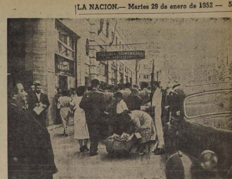
VENTAS Y CHARLATANES EN EL CENTRO. — A los miles de problemas que en toda forma afectan la vida diaria de los santiaguinos, se suman ahora las ventas de frutas y los charlatanes que llenan las veredas, no siempre anchas, del centro. En el grabado vemos un aspecto captado ayer, a las 11.45 horas, en Huérfanos, entre Ahumada y Bandera. En primer plano vemos una vendedora de frutas, y el grupo del fondo rodea a un charlatán, que vende productos "únicos" y que siempre son una "oportunidad". Las autoridades deben hacer una enérgica batida para despejar el centro y evitar que éste se convierta en mercado y no se obstruya el paso de los transeúntes.

El Subsecretario del Ministerio del Trabajo, en estas declaraciones, se refiere a publicaciones hechas por el diario argentino "La Epoca" sobre las aplicaciones de las leyes sociales chilenas.