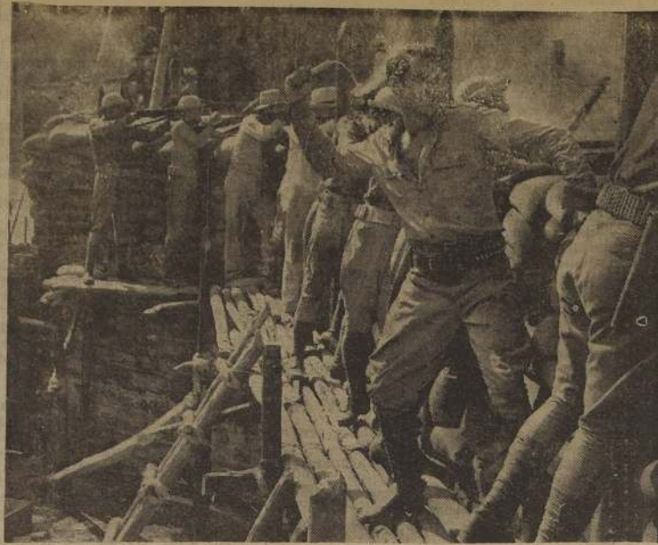
Una impresionante escena de "La verdadera gloria", film de Samuel Goldwyn, que distribuye la RKO, y que va hoy en el Santa Lucia. Gary Cooper es el astro central de la producción, que incluye en su reparto a David Niven, Broderick Crawford y Andrea Leeds.