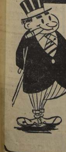
Por 3ª vez!!!

El hecho se ha producido en otras oportunidades, pero nunca con la rapidez del caso de ayer.