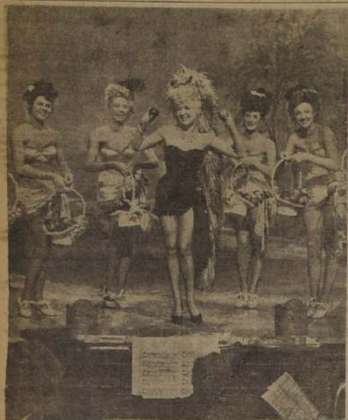
Hermosas chicas, capitaneadas por la seductora Betty Grable, aparecen en "La calle de las tentaciones". Este film va el jueves al Cine Rex.