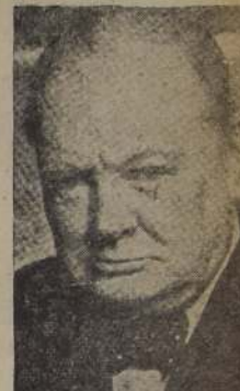
Premier británico, Winston Churchill.

"Las mujeres van a verme para aplaudirme y estimular a alguien que es de su mismo sexo".