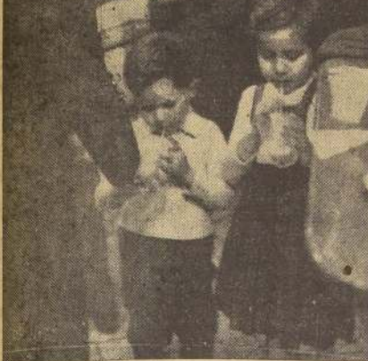
LOS NIÑOS. PRINCIPAL VICTIMA. — En una fuente de agua, los niños de la Plaza de Armas sorprendieron a la NACIÓN a estos dos niños bebiendo leche, acompañados de su madre. El consumo diario en estos establecimientos, en Santiago, está calculado oficialmente en 100 mil litros. Estas cifras hablan por sí solas de la gravedad que representa la adulteración del principal alimento de la población

LOS ANTECEDENTES SERAN ENVIADOS A LA JUSTICIA CRIMINAL