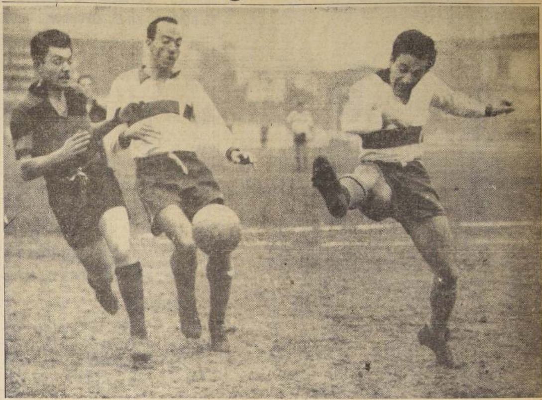
EL 29 DE JUNIO, para San Pedro, jugaron en el Estadio de Independencia, Universidad Católica y Rangers, de Talca, en disputa de los puntos del torneo oficial. Se registró un empate a dos goles. El grabado registra un pasaje del juego, en momentos en que Sánchez rechaza con violencia, en tanto que Roldán contiene la entrada de un forward suizo. Ahora, los locos enfrentarse en la revancha, en el Estadio Fiscal de Talca, donde las expectativas de Rangers se

Porque al momento en que la AFA tome una resolución oficial y concrete la misma aceptando las condiciones solicitadas por los países participantes, se encuentre con que éstos, apremiados por sus necesidades y tras una espera tan larga como infructuosa, rechacen todo ofrecimiento por estas causas a otros compromisos, todos los cuales mantienen pendientes desde hace largo tiempo a la espera de una resolución de la Asociación del Fútbol Argentino. Sería este el mejor argumento que tendrían en la mano aquellos sectores del fútbol argentino que no desean la realización del Campeonato Sudamericano. En el momento actual nada garantiza de que el torneo se hará.