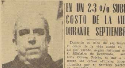
EN UN 2.3 O/O SUBIO COSTO DE LA VIDA DURANTE SEPTIEMBRE