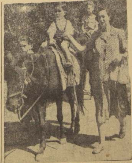
EQUILIBRIO INFANTIL. — El chico, con envidiable serenidad, se equilibra sobre la montura de un sosedado mampato eriollo. Cien pesos le demanda a cualquier padre una vuelta de 10 minutos, sobre una de estas cabalgaduras, para el hijo regalón. Los padres de otros 820 mil niños, cuyas edades fluctúan entre los seis meses y los diez años, deben hacer difíciles equilibrios para que el ítem "Entretenimientos Infantiles" no desfinancie sus presupuestos familiares.

Ya desapareció del ambiente santiaguino la costumbre tradicional de enviar a las empleadas — niñas y damas de la cocina — a dar una vuelta en carro con los menores los domingos en la tarde. En tarde de los festivales pertenece exclusivamente al servicio doméstico.