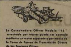
La Cosechadora Oliver Modelo "15" es movida por tractor, puede ser operada mediante un motor separado y por medio de la Tercera de Fuerzas de Transmisión Directa de los Tractores Oliver.