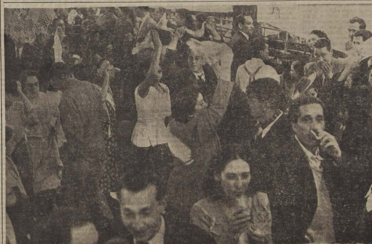
La "cueca", el baile nacional, reinó ayer en todas las festividades patrias. En el Parque Cousiño, en las comunas rurales, en la Alameda, en la Plaza de Armas, la de "pata en quinchá" fue el motivo básico de la alegría popular. Santiago vivió el más popular de sus "18", en el cual fueron exaltados los valores de la patria, y el recuerdo de los próceres que nos dieron libertad. La escena del grabado corresponde a una fonda ubicada en "un lugar del Parque Cousiño", que se caracterizó por su entusiasmo en el aniversario patrio.