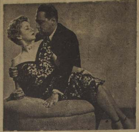
La sensacional revelación del crimen en los Estados Unidos. "Frente a los Gangsters", que estrena el lunes próximo el cine Plaza, presenta un elenco estelar con Claire Trevor, Luther Adler, Brian Donlevy, John Russell y Forest Tucker.