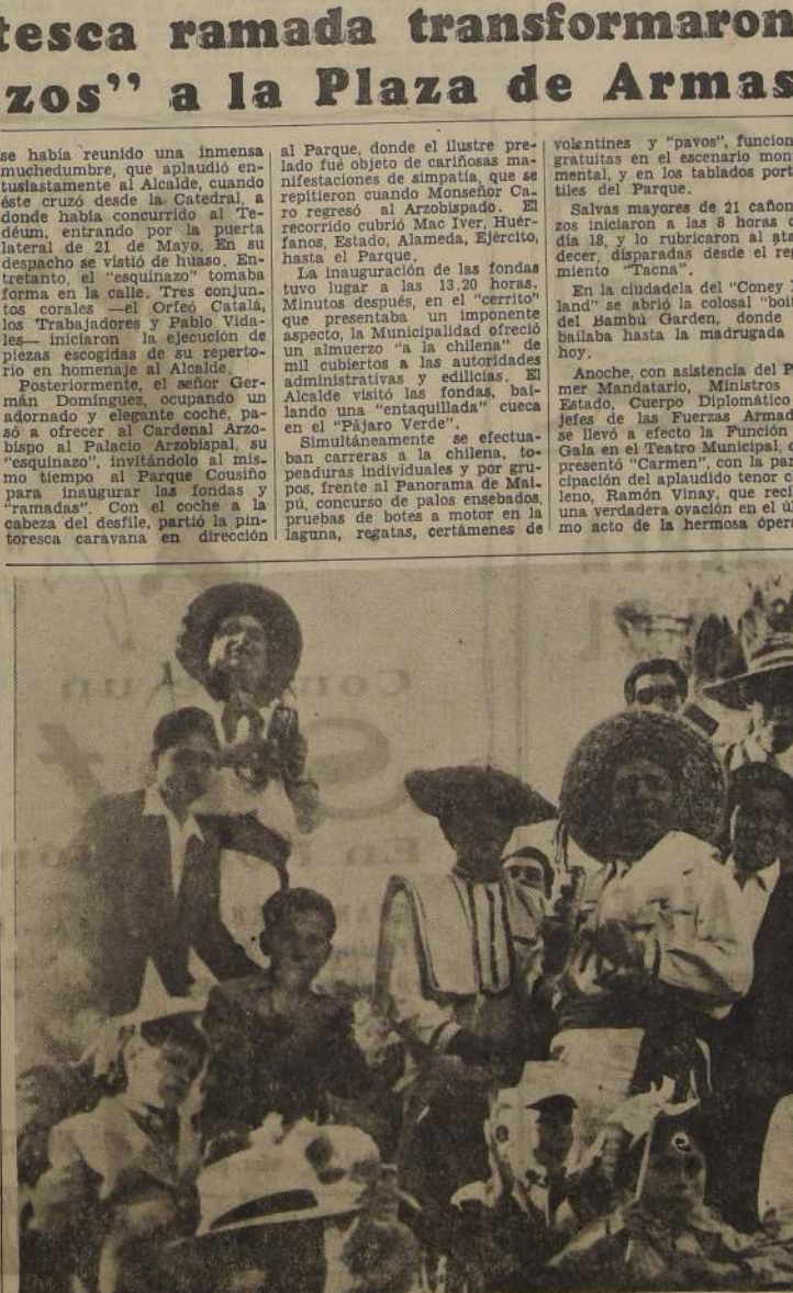
La Plaza de Armas, por primera vez en su historia, fue transformada en una gigantesca "ramada", donde había de todo lo que caracteriza a la celebración patria. Cuecas, tonadas huasos de chillonas mantas, "cantaoras", carretas, breaks, y "rinitas" enfloradas y embanderadas saturaron ayer a la capital del alegre aire campero, dando a la recordación patria todo el carácter popular que ésta debe tener.