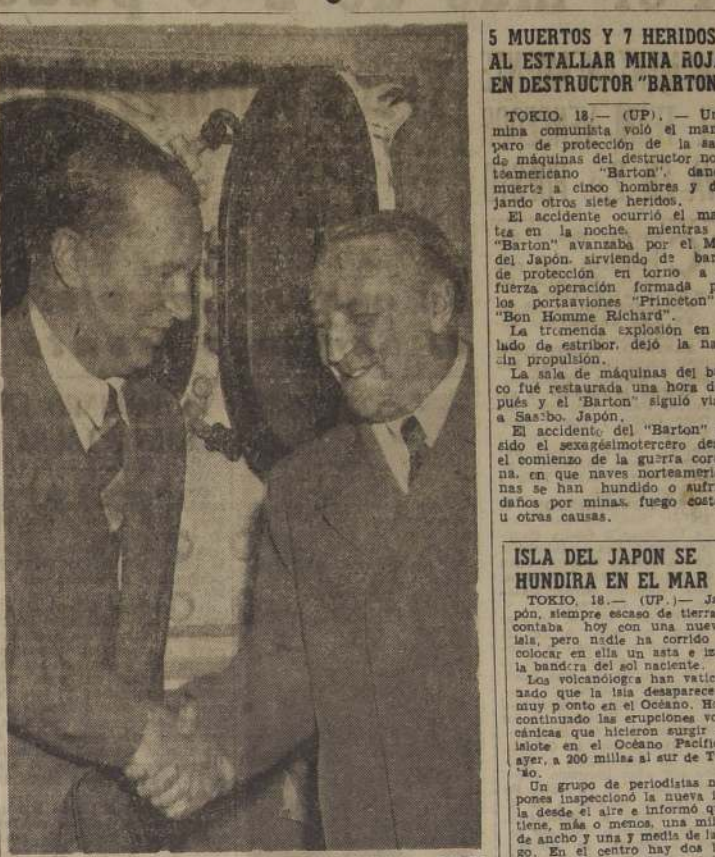
SUCESOR DE MALIK EN LAS NACIONES UNIDAS.— NUEVA YORK, 18.—(UP).—Jefe de la delegación soviética ante las Naciones Unidas durante los últimos cuatro años, saluda a su sucesor, Valerian A. Zorin, en el cargo, Zorin es Viceministro de Relaciones Exteriores, y llegó a Nueva York a bordo del transatlántico "Queen Elizabeth".

MA. tarde, el 14 de marzo, envió un memorándum pidiendo que comenzaran las negociaciones acerca de reformas de gran importancia, encaminadas a modernizar el Gobierno de Marruecos y apresurar la marcha del país hacia la completa autonomía.