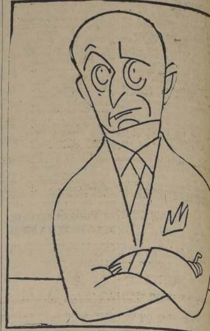
Robert Lovett, Secretario de Defensa norteamericano, señalado la necesidad de ayudar a los países latinoamericanos.