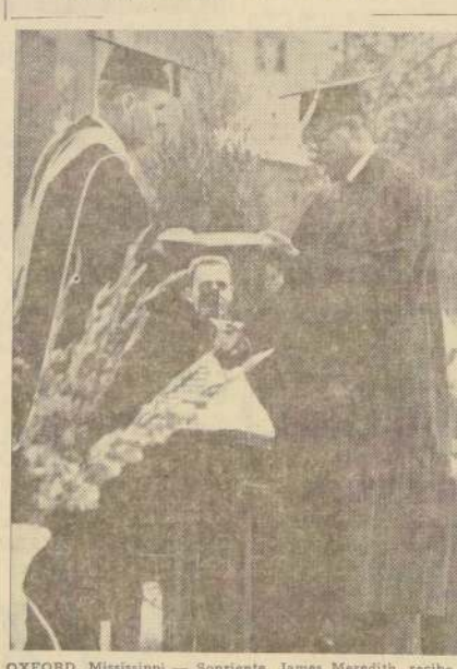
OXFORD, Mississippi.— Sonriente, James Meredith, recibe el diploma que le entrega el Rector de la Universidad de Mississippi, J. D. Williams. Meredith ha sido el primer estudiante negro que ingresó y obtuvo su título en este plantel educacional, rompiendo una discriminación que se aplicó por más de un siglo.