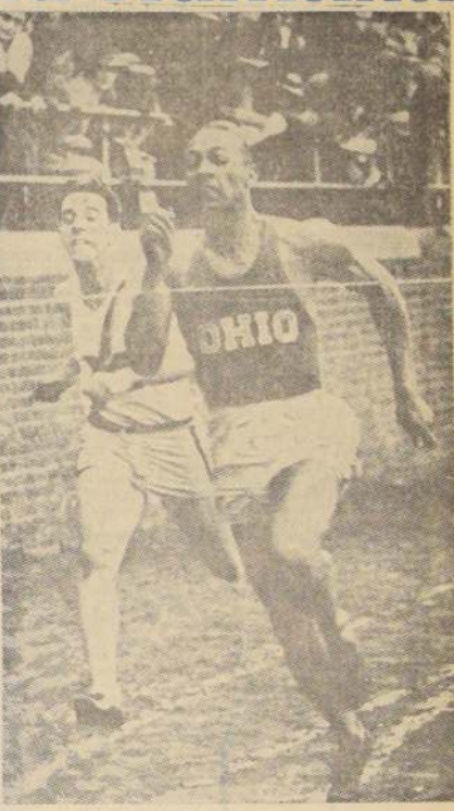
EL FENOMENO OWENS.— Jesse Owens, fue el primero que corrió en el mundo los 100 metros planos en 19'2. Fue realmente un fenómeno.

El tema no es nuevo. En las diversas latitudes del globo, de tiempo en tiempo, preocupa a los técnicos. Se me antoja —por simple deducción empírica— que en la época de las Olimpiadas griegas, más de algún inquieto o estudioso pensó en el asunto. La materia motiva de esta crónica es la siguiente: ¿TIENE LIMITE LA VELOCIDAD HUMANA? Debemos entender por VELOCIDAD —en el sentido que nos preocupa— específicamente en la rapidez en la progresión en carrera. Lejana en la escala del tiempo se halla la primera Olimpiada, dentro de la historia moderna del más clásico de los deportes. Tal hecho aconteció en 1896. Eran los priberitos daban inicio a un ciclo moderno. Se eligió como sede a la legendaria Atenas. Recomendaba la fiesta universal del músculo, luego del interregno dispuesto por Flavio Teo dosio, el año 394 de nuestra era.