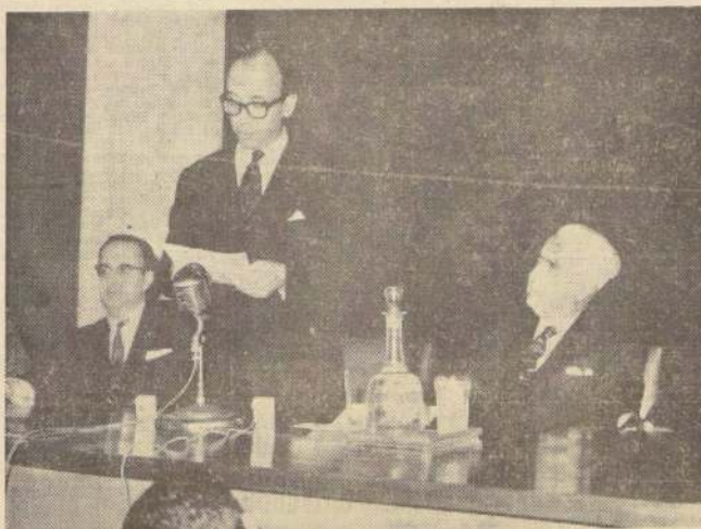
En el Salón de Actos del Ministerio de Obras Públicas se efectuó ayer la sesión inaugural constitutiva de los grupos de trabajo industriales chilenos y argentinos, que estudiarán la complementación e integración industrial de ambos países, dentro del espíritu del Tratado de Montevideo. EN EL GRABADO, de izquierda a derecha, el Subsecretario de Relaciones Exteriores, Pedro Daza; el Ministro de Industria de Argentina, Luis Gottlieb; el Subsecretario de Relaciones Exteriores, Carlos Martínez Sotomayor, sobre los objetivos del viaje y los propósitos de su Gobierno respecto a la complementación industrial de la Asociación Latinoamericana de Libre Comercio. La entrevista se realizó en el Salón Rojo de la Cancillería y estuvo presente en ella el Embajador de Argentina, Nicanor Costa Méndez.