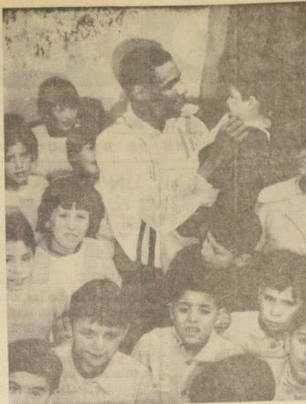
IDOLO ENTRE LOS NIÑOS.— En su breve estadía en nuestro país, Eddy Bermúdez, jugador costarricense incorporado al básquetbol metropolitano por Palestino, ha sabido ganarse el afecto y el cariño de todo el mundo. Sus extraordinarias condiciones de malabarista en este deporte lo hacen un personaje popular entre los niños, los cuales lo siguen en sus actuaciones con entusiasmo como se puede apreciar en el grabado.

Finalmente, y refiriéndose al Campeonato Nacional de Watepolo de 1964, declaró que probablemente tendrá lugar en Valparaíso, en la piscina del Deportivo Playa Ancha. La confirmación estará supeditada lógicamente a diversas bajas que quedan por realizarse en dicho escenario deportivo.