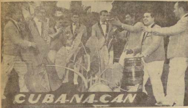
LA APLAUDIDA ORQUESTA "CUBANA CAN", actuando el sábado próximo en el gran show que será el marco artístico del sorteo de los concursantes que acertaron los 28 goles marcados en la 15a. fecha del torneo profesional de fútbol de primera división. Recién ha salido al mercado un disco grabado por esta notable orquesta, titulada "CUBANA CAN".