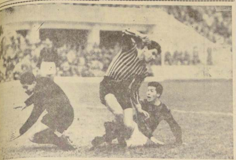
RENACIMIENTO EN TALCA. — Los atletas de la Unión de Talca están viviendo un momento de renacimiento, en la capital de la región del Maipo, a más de convincente, ha tenido la virtud de haber devuelto al fútbol a dos jugadores que, en la capital, parecían haberse perdido para siempre. EL GRABADO, este último, discutiendo dentro del área —su pasión— la pelota con Ríos y el arquero Coloma, durante el partido con Ferrobádminton el domingo último.