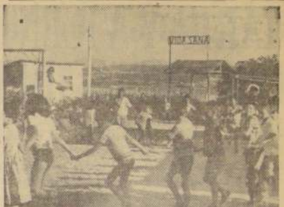
CAMPAMENTO: en el campamento de verano del Vida Sana, instalado en Lencura, participan cientos de asociados y familiares, que intervienen en numerosos actos deportivos y artísticos. Grandes y chicos se divierten a su gusto.