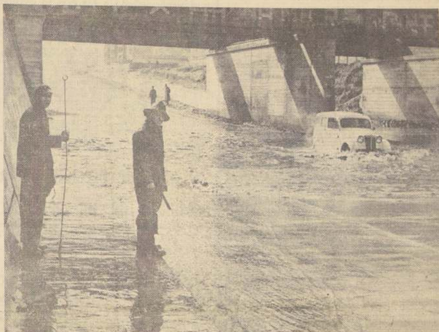
Escenas como éstas se observaron a cada instante ayer, en el paso a nivel "Carlos Dittborn", del barrio alto. El temporal de lluvia desbordó varios canales de ese sector y sus aguas, al salirse de madre, inundaron numerosas calles y avenidas, especialmente el paso a nivel indicado. Las aguas se acumularon en exceso en la parte baja de dicho sitio, como puede verse en el grabado. Cuadrillas de obreros municipales estaban hasta las últimas horas de ayer tratando de despejar el sector, abriendo nuevas salidas a las aguas.

La mina de cobre "Disputada", de Las Condes, donde trabajan aproximadamente 1.400 obreros y empleados, se encuentra desde hace dos días totalmente aislada, con sus comunicaciones telefónicas cortadas y con manto de nieve que en algunos sectores alcanza a 3 y 4 metros de espesor.