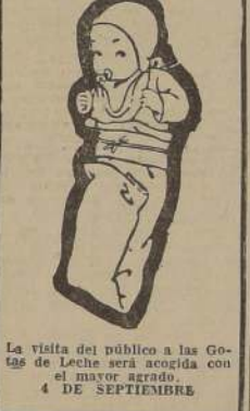
La visita del público a las Gotas de Leche será acogida con el mayor agrado. 4 DE SEPTIEMBRE

Las adhesiones se reciben en la sala central del hotel.