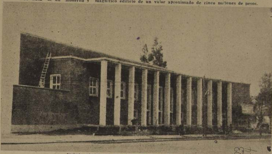
Fachada principal del edificio "Mercado Municipal" de Providencia

Se trata de un moderno y magnífico edificio de un valor aproximado de cinco millones de pesos.