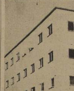
Edificio del Departamento "Rosenblitt"

permite la visibilidad del área total del departamento en el cielo, lo cual elimina, como es natural, la impresión de espacio reducido a que obliga el alto valor del terreno. Posee además este edificio, ascensor, calefacción, agua fría y caliente en todas sus habitaciones y sus correspondientes servicios. Los pasillos son amplios, con mucha luz y sol.