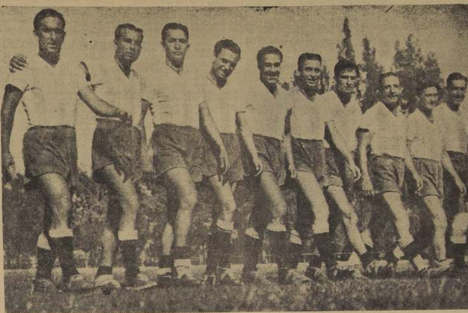
Los argentinos que tendrán el domingo un difícil compromiso.

Auspiciado por la I. Municipalidad de Santiago, el Deportivo 20 de Enero F. C. organizará un campeonato libre de fútbol, entre los clubes del barrio Independencia, para lo cual cuenta con tres copas donadas por la Comisión del Cuarto Centenario y que se denominan Pedro de Valdivia, Huélen, 20 de Enero, y diplomas conmemorativos. Esta competencia se efectuará en una de las mejores canchas del barrio, en una fecha próxima.