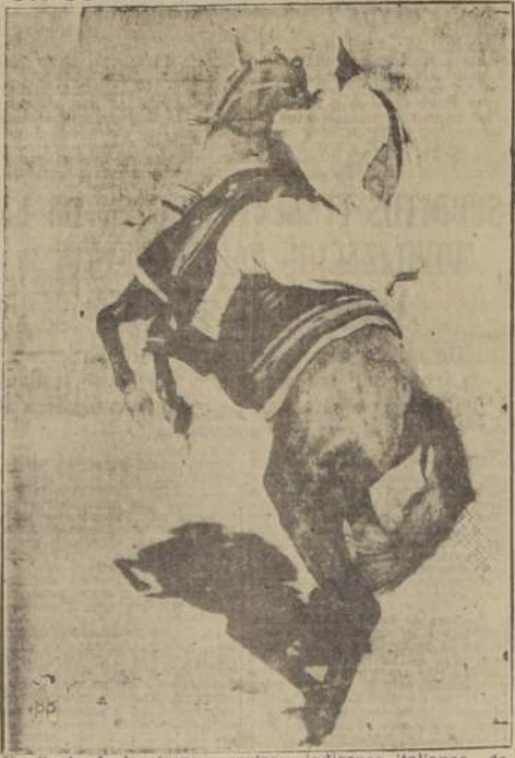
Un jinete de las tropas regulares indígenas italianas de las colonias del Africa Oriental, haciendo pruebas de equitación