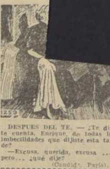
(Le Hire, París).

POR EL RITMO. Por favor avísenme cuando vaya a hacer el looping the loop otra vez. —Piloto. Ya quisiera yo saberlo. —(Popular Aviation, Nueva York). ES DISTINTO. —(Revisa su mujer sus trajes? —No, solamente mis bolsillos. —(Daily Express, Londres). PERO NO. —(Que grande sería este mundo si los que tienen dinero lo usaran como dicen que lo usaran los que no lo tienen. —(New Chronicle, Londres). DEFINICION. —(Psicología, hujó mis, es una palabra de cuatro