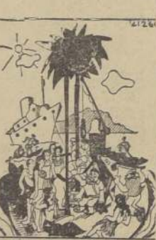
Filmado una película... Imbecil! El manuscrito dice

No se necesitan telescopios para distinguir la mera magnitud. Cualquiera puede ver a Marlene Dietrich y Claudette Colbert, con este "desfz" por una tabla inclinada, diversiones de Venice, California, donde dió un "party" a sus colegas de Ho