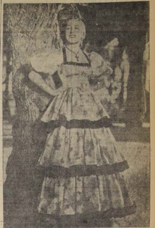
GLADYS SWARTHOUT, la celebrada cantante del Metropolitan de Nueva York, en una escena de "Rosa del Rancho", su primera labor en la pantalla

Gladys Swarthout, la gentil y célebre diva del Metropolitan de Nueva York, llega a la pantalla mundial como una triunfadora. "La Rosa del Rancho" ("Rose of the Rancho"), película de la Paramount con la cual se estrenó en el cine y a quien la obra ha colmado con ya de laureles, es al mismo tiempo que un espectáculo de múltiples atracciones, augural primicia de la carrera cinematográfica de la actriz cuya belleza seductora, cuya voz encantada y cuyo arte expresivo y calido la eleva, desde esta su primera interpretación para el lienzo, a la categoría de estrella de primera magnitud. Acción que cautiva desde el primer momento la atención de los espectadores; brillantes variedades, canciones, canciones de feroz pasión o lírica sentimentalidad; música cuyo impetuoso jubilo o cuya melancólica dulzura, aparte de deleitar a los oyentes, los predisponen a sentir más vivamente la vibrante alegría o la expectación anhelosa del drama; elementos son todos ellos que, al concurrir a realizar la interpretación de Gladys Swarthout y la del no menos notable cantante John Boles, colocan a "La Rosa del Rancho" en lugar preferente. Como espectáculo y como audición, "La Rosa del Rancho" es un acontecimiento cinematográfico y musical en la temporada.