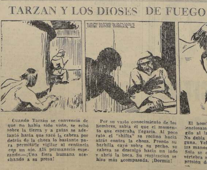
TARZAN Y LOS DIOS DE FUEGO (86) por EDGAR RICE BURROUGHS

REMATE FISCAL De orden de la Dirección General de Aduanas y Aduanamiento del Estado