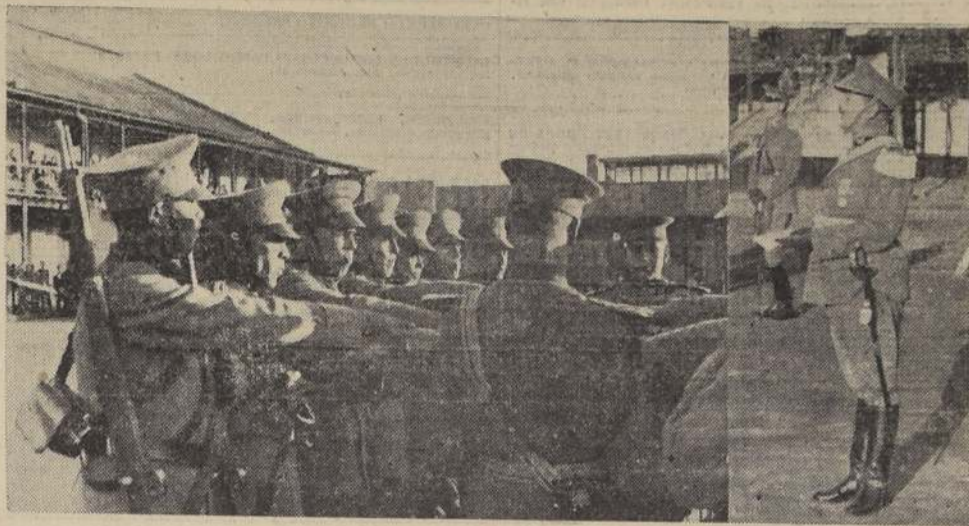
Durante la jura de la bandera en el Regimiento Maturana

Con especial brillo se celebró en el día de ayer la Jura de la Bandera y el 54.º aniversario del combate de La Concepción.