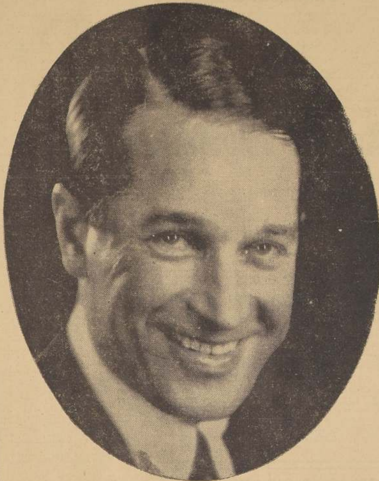
LA SONRISA DE CHEVALIER

ha conquistado a un pueblo de cien millones de habitantes por un golpe de la suerte. No hay azar tan feliz.