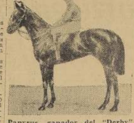
Papyrus, ganador del "Derby" de 1923.

Cameronian fue conducido por el key del Jockey V. Joe Chisholm, recorrió la distancia 1.609 metros en 1.39 2/5.