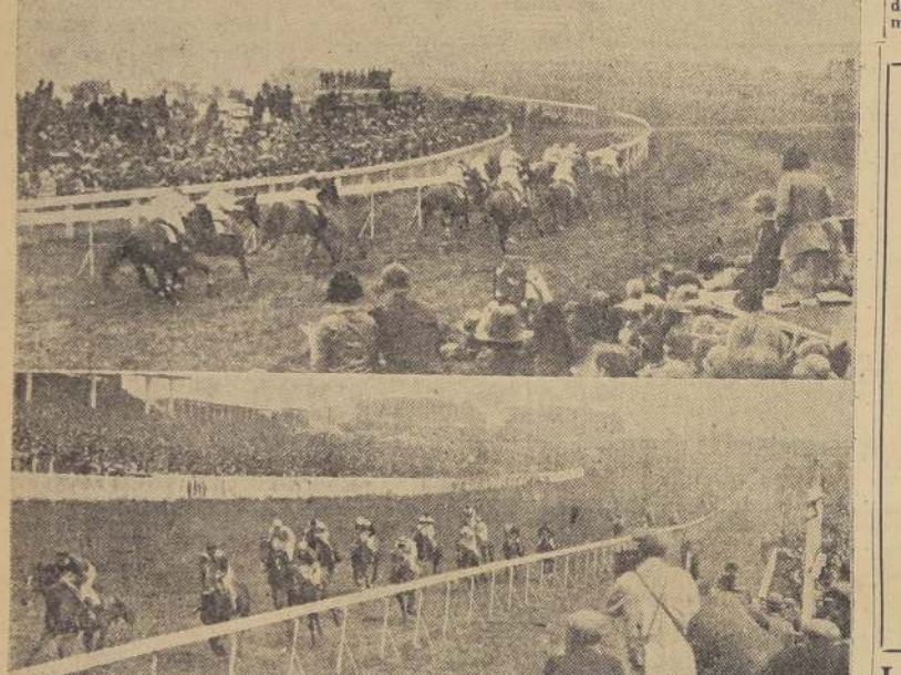
Los competidores del "Derby" de 1930, en el famoso codo de Tattenham-Corner. --- La llegada del "Derby" de 1930: Blenheim bate fácilmente a Hlad, Dilotte, etc.

Steve Donoghue, que conquistara las espuelas de oro donadas por el Príncipe de Gales, ha ganado seis veces "El Derby". Muchas celebridades del mundo han participado en esta prueba, pero ninguna ha ganado más de una vez. El "Derby" de Epsom, que constituye el trofeo más prestigioso que puede conquistarse en el mundo del turf, ha sido ganado por 139 jockeys en 139 años. Seals Derby-winners han ganado el gran trofeo inglés, ninguno otro profesional. Su primer triunfo lo conquistó con Pommer, el año 1915, y en 1917 repitió la victoria, guiando a Gay Crusader, pero, como ambos Derbies se corrieron en Nueva York, en Epsom, con motivo de la guerra, no pueden ser considerados como legítimos triunfos. Los años 1921, 1922 y 1923 marcan la época de gloria para Donoghue, pues, dirigiendo a Humoral, Captain Cuttle y Papyrus, se adjudicó los tres Derbies de oro que obsequia el Príncipe de Gales, que ganó tres Derbies seguidos. Finalmente, el año 1928, el popular jockey obtenía su última victoria, guiando a Jacopo, que contaba con las preferencias de la cátedra. Para hoy Donoghue tiene a su cargo la dirección de Lough, que estaba contratado para el Derby de Epsom, pero, según noticias de última hora, el caballo ha sido retirado y hasta ahora el gran jockey no ha contraído ningún otro compromiso.