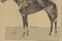
Teddah, por Janissary, ganador del "Derby" de 1898.