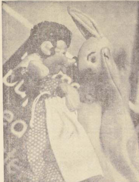
El mundo de los niños chilenos se verá poblado por mucho tiempo por unos títeres compañeros: los títeres, que vendrán de todas partes del mundo para darles un poco de fantasía y felicidad.

Dijo, dando cifras, que los principales métodos anticonceptivos aplicados durante 1966 fueron: IUDs, a 33.086 mujeres (57%); Métodos vaginales, 771 mujeres (1,35%); esfuercos, 22.119 mujeres (38,6%); y Ritmo, a 2.116 mujeres (3,1%). Dio a conocer la Dra. Pfau, que a pesar de que las actividades de planificación familiar en Chile se encuentran dentro de los dominios del Servicio Nacional de Salud, estas no fueron reconocidas oficialmente hasta el 21 de abril de 1966, oportunidad en que el Gobierno anunció que el control de la fertilidad estaba adecuadamente integrado a los Servicios Nacionales de Salud Materno-Infantil.