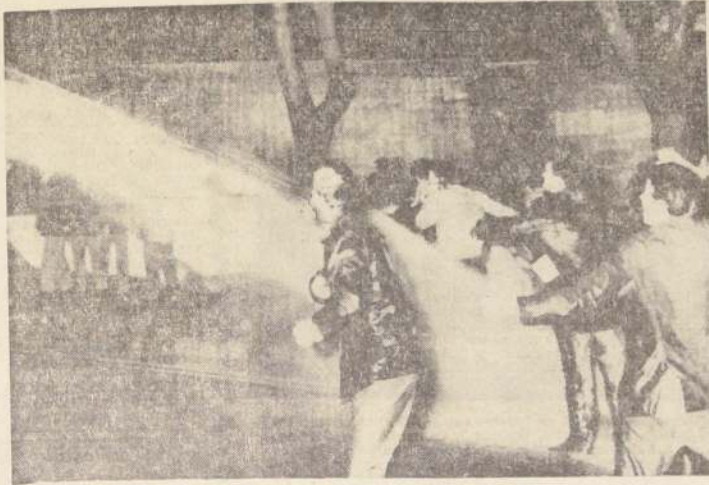
Al grito de 'Ho Chi Minh', numerosos jóvenes romanos pretendieron hacer una manifestación ante la Embajada norteamericana en Italia y chocaron violentamente con la policía, que trató de disolverlos con chorros de agua, como el que muestra el grabado.