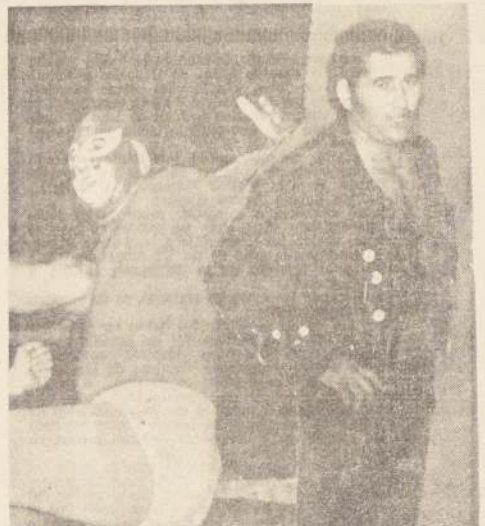
EL CORDOBES Campeón de España