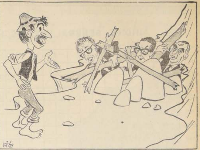
VERDEJO: ¿Por qué le cierran el camino al pueblo?

No es éste, indudablemente, el camino para llevar adelante los cambios que Chile necesita. No es ésta, definitivamente, una fórmula que pueda discutirse con seriedad. La actitud de los socialistas revela por consiguiente una falta total de interés por encontrar las vías de un diálogo que pueda servir a los intereses del país.