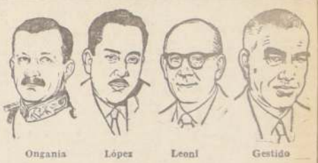
Onganía López Leoní Gestido