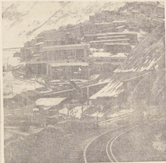
Sewell recibirá un baño renovador.