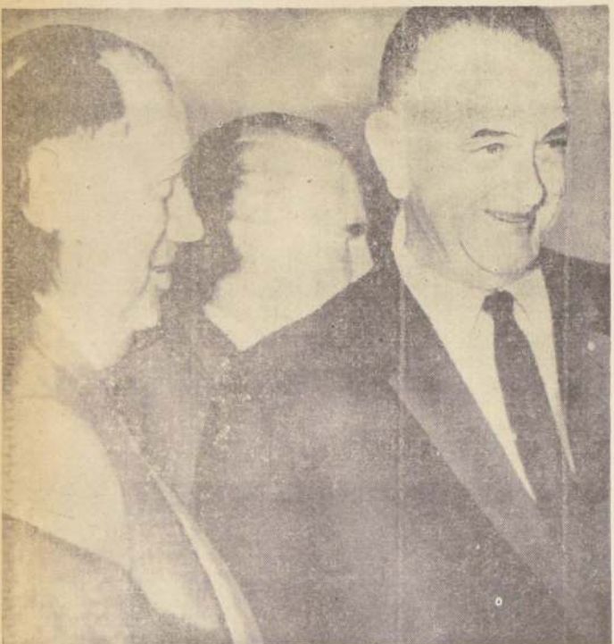
Punta del Este se ha convulsionado con la presencia de los mandatarios americanos, que están tratando la forma de apurar la integración y resolver otros graves problemas del continente. Principal actor ha sido, desde luego, el Presidente Lyndon Johnson, que aparece en el grabado, acompañado del Presidente Alfredo Stroessner, de Paraguay.