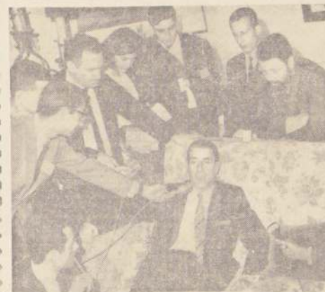
Periodistas de todo el mundo han cercado al Jefe de Estado chileno para conseguir declaraciones sobre temas de quemante actualidad.

PUNTA DEL ESTE, 13 (ANSA).— El primer cráter de la sesión informal realizada esta tarde en la Sala de las Américas, del Hotel San Rafael, fue el Presidente del Ecuador, Otto Arosemena Gómez. La intervención de este Mandatario trajo al seno de la Reunión Cumbre momentos de suma tensión, debido al tono y a las palabras por él pronunciadas. Dijo Arosemena que no venía a Punta del Este a firmar un documento al viejo estilo de suscribir con la que no se estaba de acuerdo. El Presidente de México, le respondió con firmeza, señalando que nunca ningún documento normativo al 100% de los países y que es costumbre hacer concesiones para arribar a conclusiones felices. Asimismo el Mandatario mexicano, Gustavo Díaz Ordaz, rechazó el calificativo que Arosemena había lanzado hacia sus colegas de irresponsabilidad. La disyun-