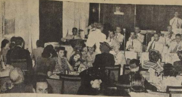
Ray Ventura y sus Colegiales del Ritmo actúan diariamente en el Living del Hotel, a la hora del té, recogiendo entusiastas aplausos de la numerosa y distinguida concurrencia que asiste diariamente a este Salón.