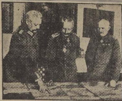
La situación militar se presenta con amenazas de derrota para el Kaiser, Hindenburg y Lüdendorff en el verano de 1918; una crisis semejante se cierne sobre Hitler y sus consejeros (Goering y Keitel, comandante de la Wehrmacht) en el presente verano de 1944.

El mayor número de bombarderos pesados empleados hasta la fecha en una sola operación se desplegaron en la batalla de Francia y en el bombardeo de la nueva fábrica alemana de tanques en Linz, Austria. Más de 1.500 bombarderos e igual número de cazas atacaron las posiciones de la Wehrmacht.