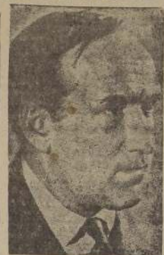
Don Arturo Matte Larraín, Ministro de Hacienda

Dice: 756-1146 Espinoza E. Miguel Manuel, Emboscada s.n., $2.600. Debe decir: 756-1146 Riveros Espinoza Miguel, Emboscada s.n., $2.600.