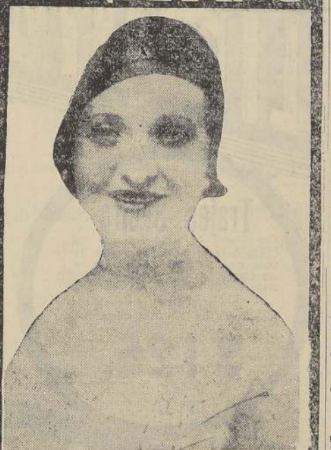
LA ESTRELLA MAXIMA DE LOS ESCENARIOS EUROPEOS