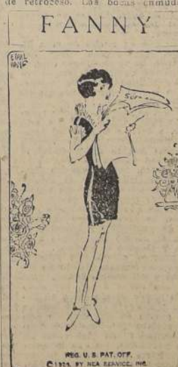
dice que los hombres con aspecto de santos son los primeros caer en la tentación

«¿La señora estaba bien?, ¿está bien?», preguntó con voz serena y patriótica la región. En momentos de cerrar la sesión, nos comunicó que los cuatro compañeros han sido halados. ¿Cómo han llegado a abrir la puerta la conciencia? ¿El castigo? ¿Alto todo ha sido el castigo en esta singular aventura?» Al día siguiente "El Faro" trajo este suelto: «Con un profundo dolor hemos bido que el señor González, nuestro distinguido colaborador, uno de los arriegados ciudadanos acudieron desde el primer día al teatro el crimen, ha sufrido la ejecución al ver aparecer al jovito y a sonriente labios, el cadáver de los criminales, que ha sido víctima de un temblor nervioso que todavía dura. Hacemos votos por la memoria de nuestro almafalete valeroso y sus compañeros almasfalete»