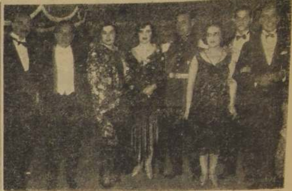
Un grupo de asistentes al baile

HAY UN GRAN PLACER EN JUZGAR UNO EN SU CONCIENCIA QUE ES MEJOR QUE LO QUE LO JUZGAN LOS DEMAS