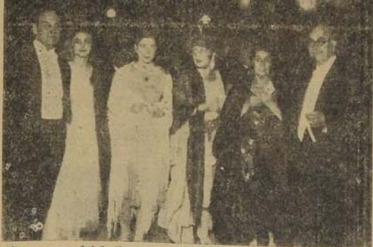
Un aspecto del baile típico español, realizado el miércoles en el Club de Viña del Mar