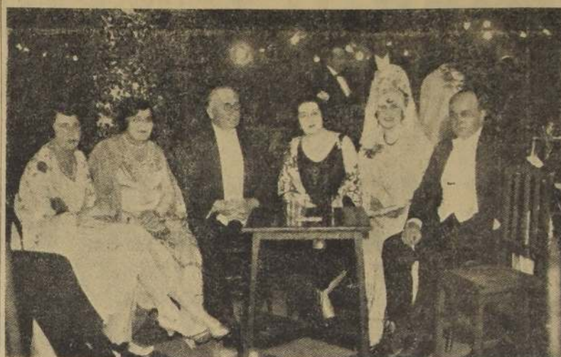
Otro aspecto del baile típico español, realizado el miércoles en el Club de Viña del Mar