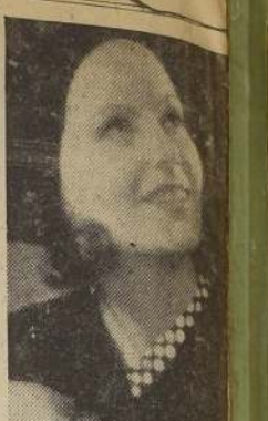
GRETA GARBO FUE CONDECORADA POR EL REY GUSTAVO ESTOCOLMO, 30. (U. P.) — El Rey Gustavo, en Oslo, condecoró a Greta Garbo con la medalla de oro: "Litteris et Artibus".

Esta recompensa es una de las más altas distinciones que Suecia destina a talentos artísticos.