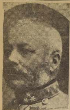
EL ARCHIDUQUE FRIEDRICH Y LA ARCHIDUCESA MARIA FALLECIERON AYER INNSBRUCK, 30. — (U. P.) Falleció en el hospital la Archiducesa Maria de Hapsburgo, a la edad de 35 años. Era nieta del Emperador Francisco José. BUDAPEST, 30. — (U. P.) Murió el Archiduke Friedrich de Hapsburgo, a las 8.30 A. M.