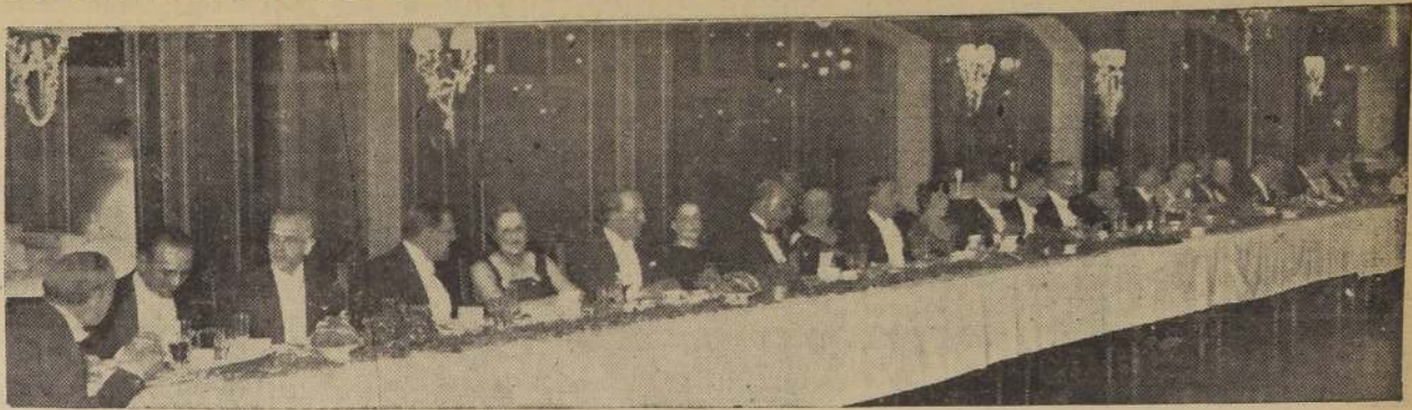
En los comedores de Gath y Chaves se llevó a efecto anoche la comida mensual que el Rotary Club de Santiago dedicó en honor del Canciller del Brasil, Excmo. señor José Carlos de Macedo Soares, ilustre rotario brasileño. El eminente estadista brasileño hizo el viaje especial desde Valparaíso, donde se en-

contraba, para concurrir a esta fiesta, gesto que contribuyó a hacer más simpática su presencia y que motivó una calurosa recepción de parte de los rotarios santiaguinos. Aparte del ilustre huésped, asistieron a la fiesta de anoche el Ministro de Relaciones Exteriores señor Miguel Cruchaga Tocoarnal; el Embajador del