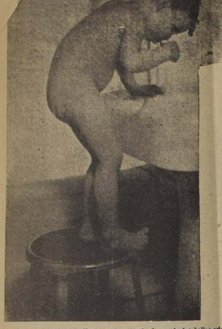
Aun cuando la fotografía no entre en el género de las bellas artes, ésta merece estar clasificada como obra de esa naturaleza.

CONOCI un madrileño que, cuando perras, bailaba el cancan. CONOCI un mudo que hacía las cosas a capilla. CONOCI un cura en capilla. CONOCI un tipo demasiado humano que un hombre morir de hambre, exclamó: "¡Maldita de una vez para que deje de sufrir!". CONOCI un balsero que, al morir, pidió: "¡Balsáman!". CONOCI un capataz que no jugaba al fútbol, comía los boones.