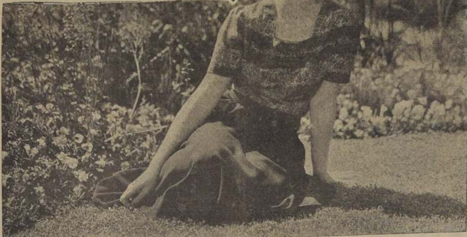
Myrna Loy, actriz de la M. G. M., más bella que nunca en su quinta de California.