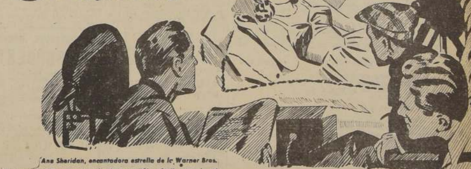
Ana Sheridan, encantadora estrella de la Warner Bros.

Nuevas estrellas, nuevas películas son "filmadas" en todo el mundo por medio del equipo RCA Phonophone usado en los estudios principales dondequiera que se "filmen" las mejores películas—Hollywood, Argentina, Australia, Brasil, Chile, Inglaterra, India, México, Rusia, España y Turquía.