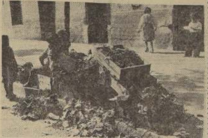
La planta industrializadora y la modernización del equipo de aseo son soluciones básicas para un problema que pesa como un estigma sobre la ciudad: la basura. Esta semana se llamará a propuestas públicas.