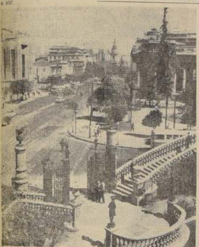
La Alameda, mirada desde el Cerro Santa Lucía. Es de importancia crear una nueva vía paralela a nuestra principal avenida, para descongestionar el tránsito. Esta obra está contemplada en el Plan.