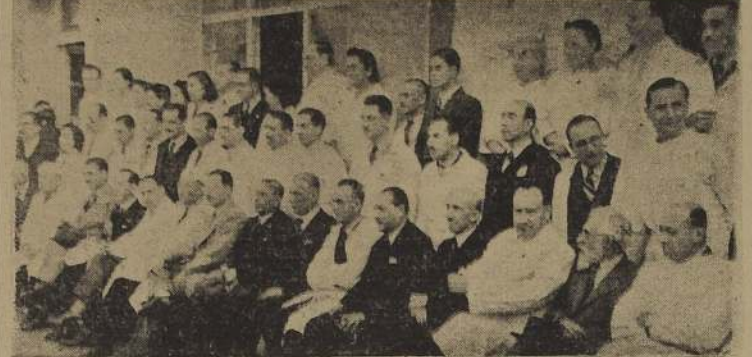
S. E. el Vicepresidente de la República, el Ministro de Salubridad y médicos del Hospital del Salvador

Asistieron el Excmo. señor Jerónimo Méndez, el Ministro de Salubridad Dr. Salvador Allende y personalidades