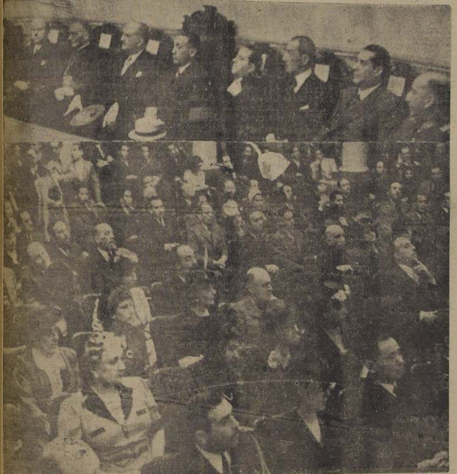
Arriba, la mesa de honor que presidió el acto en homenaje del Canciller argentino.— Abajo, parte del numeroso público que concurrió.

En el Salón de Honor de la Universidad de Chile se realizó en la tarde de ayer, la sesión pública y solemne del Instituto chileno-argentino de Cooperación Intelectual, en honor del Canciller de Argentina, Excmo. señor Enrique Ruiz Guinazu, y miembros de la Embajada Extraordinaria a la Transmisión del Mando.