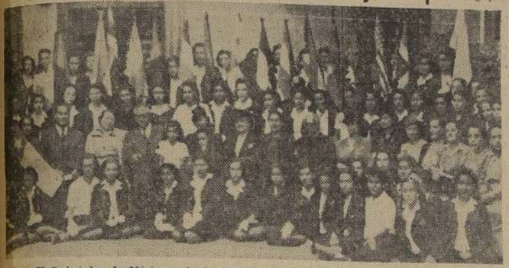
El Embajador de México, rodeado del profesorado y de las alumnas del Liceo.