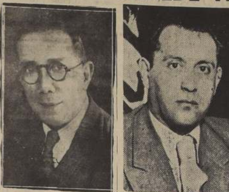
Don Carlos Cifuentes, presidente del Partido Democrático

La primera serie se compondrá de cinco votaciones con un quórum del 90 por ciento; la segunda serie será de tres votaciones con un quórum de 80 por ciento y en la tercera habrá sólo una votación en que se limitará únicamente a los dos candidatos que hayan obtenido las más altas mayorías.