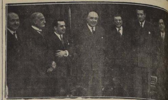
El Excmo. señor Duhalde rodeado de algunos de los miembros del Instituto Económico Argentino que lo visitaron ayer

AYER SE LE COMUNICO OFICIALMENTE AL EXCMO. SEÑOR DUHALDE SU DESIGNACION DE PRESIDENTE HONORARIO