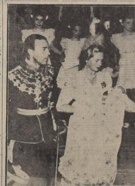
Varias testas coronadas caen y otras tambalean; los países nórdicos sin embargo no parecen inclinados por ahora a prescindir de las suyas. Bautismo del príncipe heredero de Suecia, Carlos Gustavo.