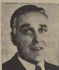
Excmo. señor Duhalde, proclamado candidato a la Presidencia de la República

La proximidad de las elecciones presidenciales, que se celebrarán el próximo 25 de agosto, ha llevado a los partidos de la izquierda a una serie de reuniones con el fin de discutir la posibilidad de una combinación de centro.