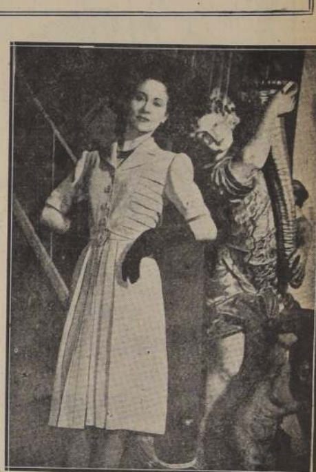
Vestido de tarde en jersey negro, faldón drapado sobre las caderas, en satén negro. Sombrero de terciopelo negro y aligrettes. Modelo de Jean Patou.—2. Traje de noche de Marcel Rochas en surah escocés azul grisado y rosa. Flores adornadas de alforzones. Modelo de Maggy Rouff.—3. Vestido de Marcel Rochas, en lana azul cielo. Pollera de lanilla negra.—4. Vestido de Marcel Rochas, en lanilla de color gris perla, adornado de alforzones.