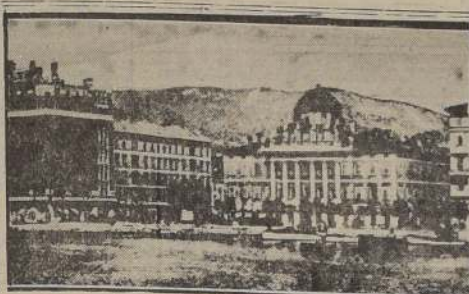
Una vista del puerto de Trieste

Un soldado americano fue asesinado y otros dos heridos. Los atacantes eran soldados italianos.