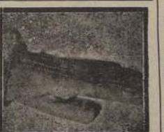
Los accesorios del tocado. Guante de gamuza verde, forrado con conelo.