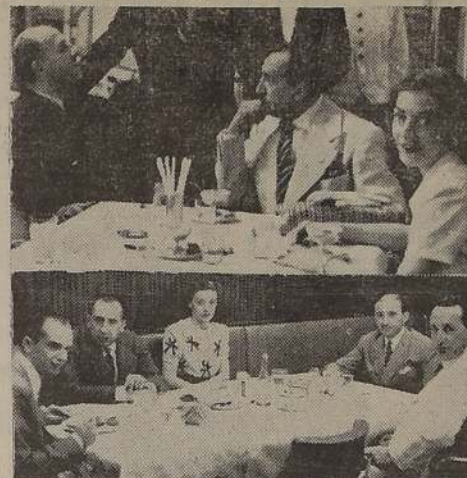
El gran actor Pepe Arias y su esposa asisten al Grill Room y Roof-Garden de la Carrera, donde son muy agasajados por sus amistades.