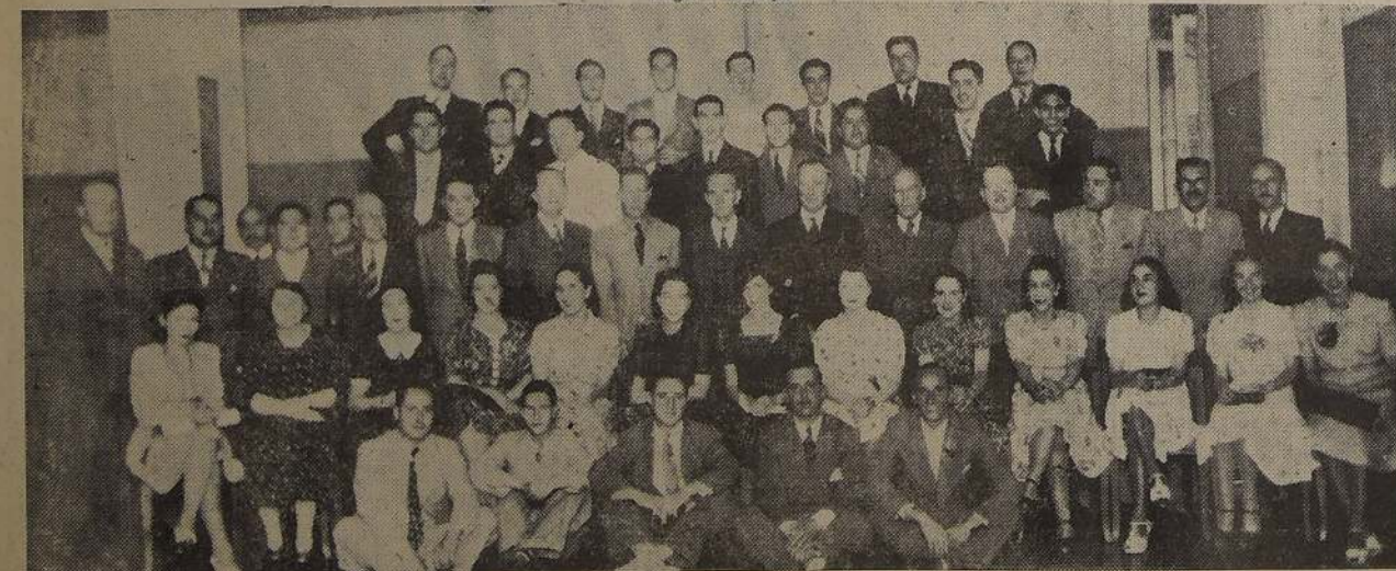
El personal de empleados de la firma Williamson Balfour y Cia. de Santiago, celebró el término del año con una magnífica fiesta en el salón de recepciones de la Confeitería LUCERNA