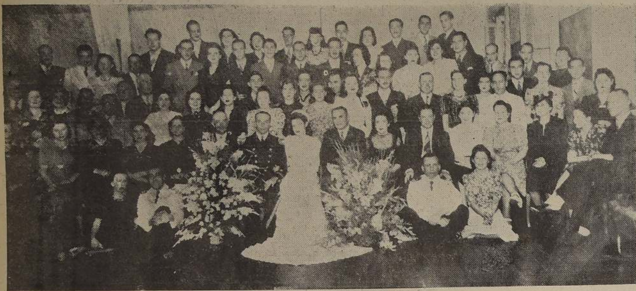
Matrimonio realizado últimamente en los salones del LUCERNA