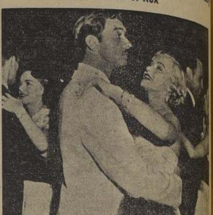
La rutilante Marilyn Monroe, llamada la atómica de Hollywood, en un cadencioso bolero con Zachary Scott.

Indiferente a los requerimientos de la rutilante Marilyn Monroe, parece estar Zachary Scott, en el festivo film "Me jugué la mujer", que hoy estrena el Rex