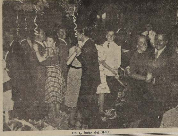
En la boite del Hotel