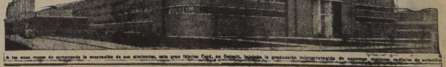
A lo largo de estos 50 años la experiencia de sus similitudes, esta gran fábrica Ford, en Detroit, ha sido la producción inintermitente de autos modernos, rápidos de servicio.