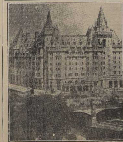
Le Chateau Laurier, donde se hospeda el Presidente Ríos