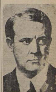
LONDRES, 23.—(U. P.). — El responsable del Exchange Telegraph, en Oslo, informa que Vidkun Quisling fue ejecutado a las 2.45 A. M. en la Fortaleza de Akershus.