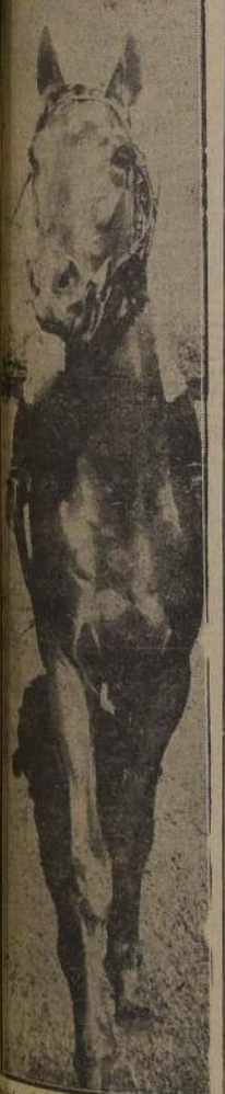
La fotografía del vencedor "El Ensayo", Florete, tomada desde el fondo por nuestro Reportero. Completamente satisfecho por el caballo, ha quedado a la espera del cual sólo se ven sus botas.

Viendo a la carrera misma, los tempranos miles de fanáticos habían trasladado al cir-