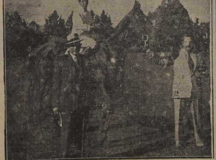
Florete, después de su brillante victoria en "El Ensayo" es tenido de la huida por sus propietarios mientras el público le prodiga un caudioso aplauso