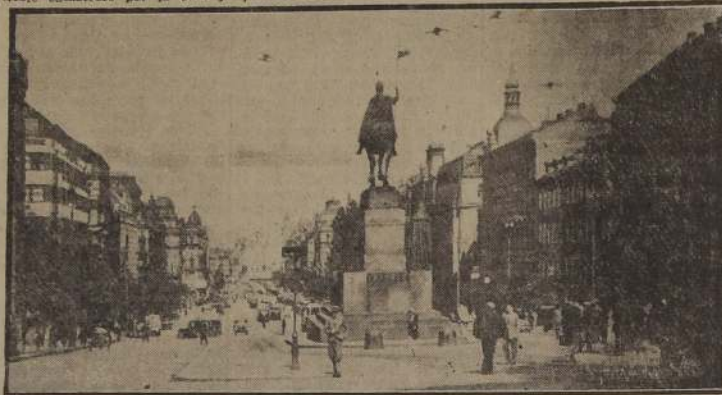
Plaza de Wenceslao, de Praga, capital de Checoslovaquia

eslovaca y para el mundo que anhela la paz, este gran estadista, el último de aquellos, que habían trabajado para la victoria de la democracia ya durante la Primera Guerra Mundial, ha sobrevivido victoriosamente también la Segunda Guerra Mundial, y volvió a trabajar de nuevo para asegurar una paz duradera y el entendimiento entre las naciones y los Estados. Su admonición viviente entre la primera y la Segunda Guerra Mundial no fue oída por el mundo, y advino al mayor sufrimiento del mundo, la más horrible catástrofe por la cual la