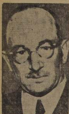
Excmo. Sr. Eduardo Benes, Presidente de la República de Checoslovaquia