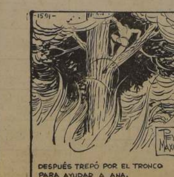
TARZAN OYÓ UN GRITO DE AÑA PIDIENDO AUXILIO, Y MIRÓ HACIA ARRIBA.