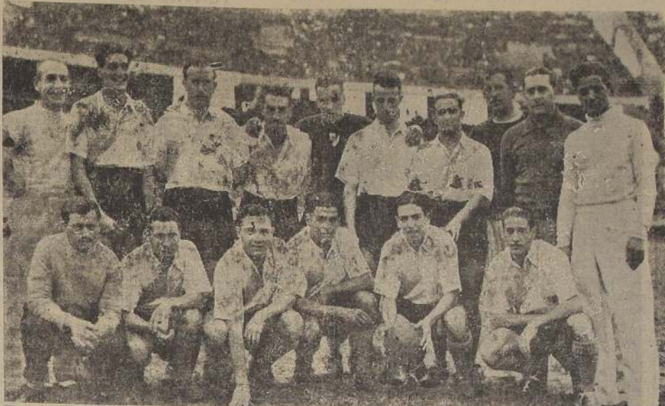
El equipo de River Plate, vicecampeón del fútbol argentino, que llega esta noche a Santiago para debutar el domingo con Colo Colo

La Reina y su Corte presenciarán el partido internacional desde el ex-palco de los periodistas, que será convenientemente ampliado y los deportistas tributarán un homenaje floral.