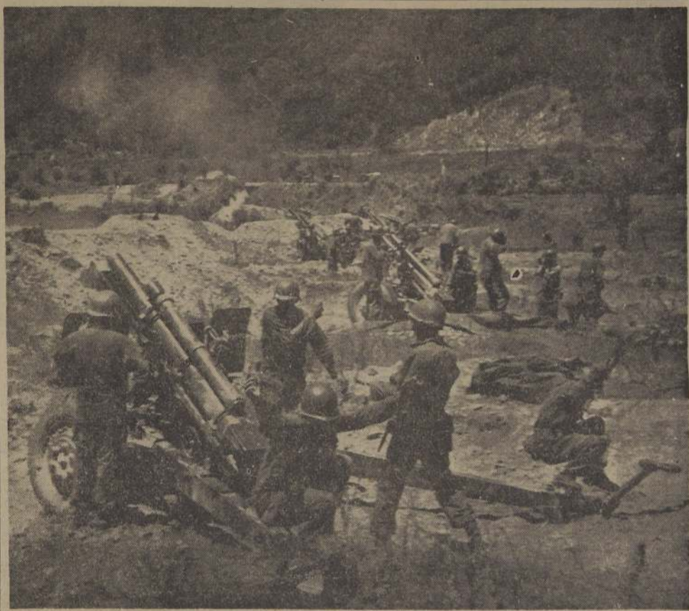
FRENTE DE COREA.— Montados con rapidez en el lecho seco de un río, estos Howitzer empiezan a bombardear las posiciones comunistas situadas en los cerros.— (Esta fotografía fue tomada bajo el fuego de los rojos por un fotógrafo de LIFE)