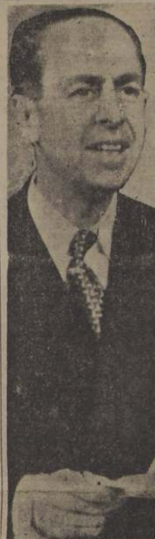
DON PEDRO ENRIQUE ALFARO, Ministro del Interior y presidente del Comité Económico de Ministros que redactó el proyecto del Gobierno para combatir la inflación y que hoy será estudiado por el Gabinete para enviarlo al Congreso a la brevedad posible. El Proyecto en referencia constituye un esfuerzo serio y definitivo para ordenar el desarrollo económico del país, ya que aborda integralmente todos sus aspectos.

Luego entra a considerar lo que son terrenos de riego y de secano, y establece pautas sobre los porcentajes de cultivos que serán obligatorias para los agricultores, pautas que están relacionadas con el valor mismo de los terrenos. Así, por ejemplo, en terrenos de riego que se cotizan a más de 10.000 pesos la hectárea, los agricultores tendrán la obligación de cultivar por lo menos el 90 por ciento de sus cultivos. En terrenos de secano, cuya hectárea tenga un