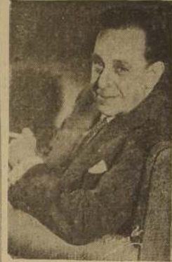
Esta tarde debuta en el Municipal la Cia. de Alta Comedia Ernesto Vilches

Un acontecimiento artístico se registrará hoy con motivo de iniciarse en el Teatro Municipal la temporada de alta comedia que viene organizando desde hace varias semanas el eminente actor español Ernesto Vilches, y en la que presentará a Virginia Luque, joven actriz considerada como la revelación del teatro y la pantalla argentina, con un magnífico conjunto de artistas chilenos, en el que figura la estrella del cine nacional María Teresa Guzmán. El debut de la gran Compañía que encabeza Ernesto Vilches, se llevará a cabo esta tarde a las 8.30, y luego a las 22 horas con la hermosa comedia norteamericana de Leo Dietrichstein, "El Eterno Don Juan", obra que ha constituido en todas partes uno de los éxitos más decididos del insigne comediante hispano, y que será llevada a escena con la mayor propiedad y buen gusto. Como algunos recordarán en "El Eterno Don Juan" (The great lover), Vilches encarna con extraordinario realismo y aguda observación psicológica a un famoso cantante lírico en las vísperas de perder para siempre la voz. Unido a esta situación dramática surgen distintas situaciones amorosas tejidas de fino humorismo y delicada emotividad que dan a la obra poderoso interés y que cautivan la atención del público. Además de las figuras ya citadas en la plana mayor de la Compañía, tendrá especial lucimiento en la comedia de Dietrichstein