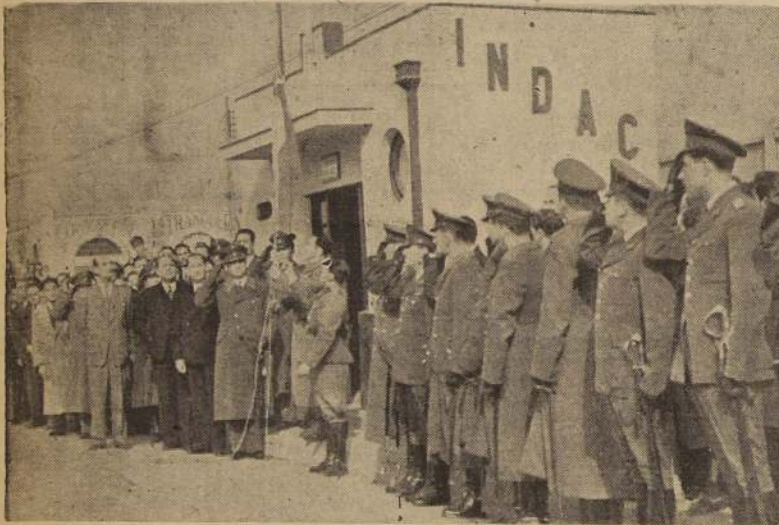
A los acordes del Himno Nacional, la bandera de la Patria flamea en la nueva Caseta-Retén