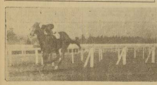
Achita G. cuenta de Frenada y Jaffa en el premio "Roberto Vial Souper", carrera especial para potranas de dos años que no hubiesen corrido

Los honores del triunfo los obtuvo aquí "El Diario Ilustrado" sobre "La Opinión", "El Mercurio" y "El Imparcial", que integraron la tabla, en el mismo orden. Pelicitamos a los vencedores de ambos torneos, que tratan siempre de informar al público en forma documental y amplia, no omitiendo en momento alguno ni esfuerzo al sacrificio para cumplir a conciencia la consigna que se ha trazado el periodismo hípico: "Informar y orientar en forma desinteresada y eficaz".