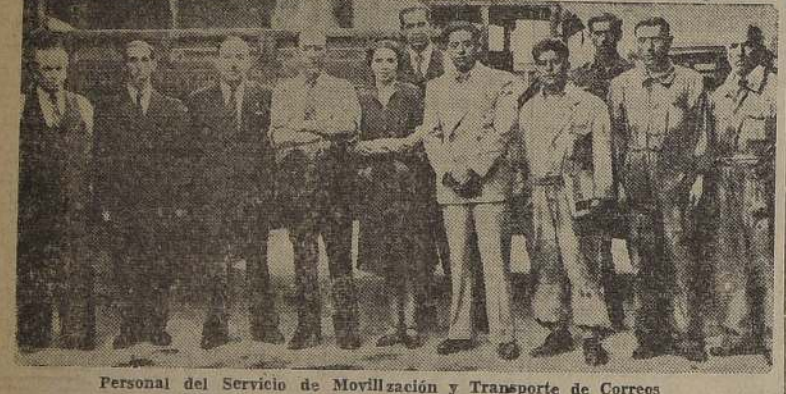
Personal del Servicio de Movilización y Transporte de Correos

Este tiene capacidad para 30 camiones y camionetas y 6 motocicletas con side-car, que es el material rodante del Sector Postal de Santiago