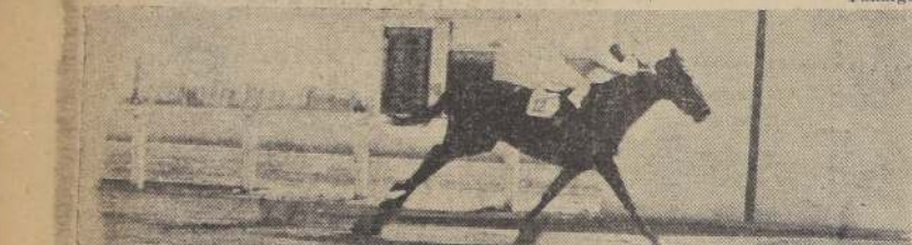
Rada sorprende a la caterva en la segunda carrera

ron a Cabimbar y Allie, que avanzó mucho al final. Último Beaulieu.