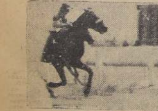
La Grele da cuenta estrechamente de Pécora, Chinchoso y Segador

El Comisario, tras corta deliberación, acordó distanciar a Vigo al segundo lugar, pasando Abolenga al primero.