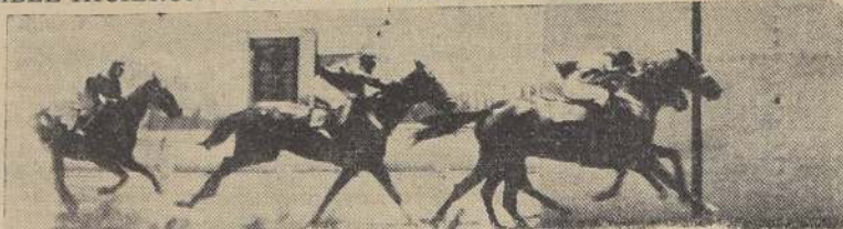
Panurgo e Indomable hacen "puesta" en la prueba de clausura

La tercera carrera se resolvió por la victoria de Vigo, que derrotó es-