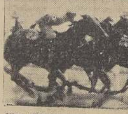
Vigo (distanjado) derrota estrechamente a Abolenga, clasificándose tercera Capullo

A continuación se disputó la primera serie de 900 metros y que fue una sorpresa para la caterva, pues se impuso La Grele sobre Pécora, abonando $ 116.70 por unidad.