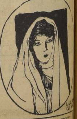
Hondo, filosófico y enor- mante es "Y EL MUNDO MARCHA"... la obra suprema de 1929.

ROTATIVAS $ 1.20. — 3 a 5 P. M. POR QUE SOY COBARDE de BEN LYON. Sólo para mayores REPUBLICA ESP. Y NOCHE IRENE LA MODELO por Colleen Moore. Sólo para mayores