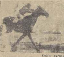
Colin aventaja por pascuero a Fresca, quedando tercero Nervión