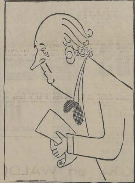
Tom Connally, presidente de la Comisión de Relaciones del Senado norteamericano que dió la bienvenida al Presidente de Chile.