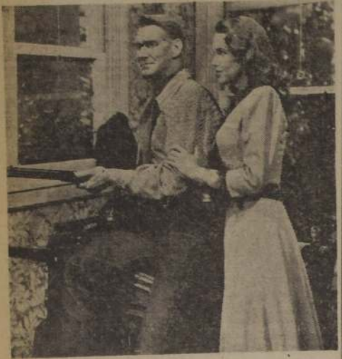
La hermosa Barbara Britton y Sonny Tufts, aparecen en esta escena que pertenece a la película "El pendenciero", que el martes exhibirá el cine Continental. Esta obra de Columbia fué dirigida por Charles Lamont y su realización es en technicolor.