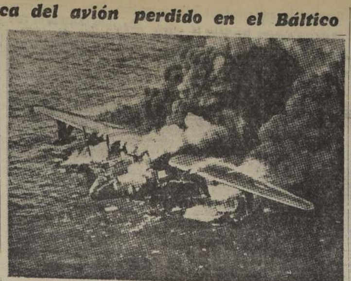
Envuelto en humo y llamas yace sobre el mar el gigantesco avión Marshall Mars de 72½ toneladas, momentos después de un descenso forzoso a dos millas de Honolulu. Esta gran máquina, que una vez transportó 301 pasajeros y 7 tripulantes, realizaba un vuelo de prueba para verificar el estado de uno de los motores cuando éste se incendió y la máquina se vio obligada a descender sobre el mar. Los 7 miembros de la tripulación fueron rescatados, indemnes

Algunos otros parajes fueron recorridos hasta 20 veces durante las pesquisas de los últimos seis días.