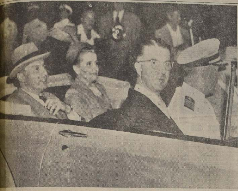
WEST.— (Florida).— El Presidente de Chile, Excmo. señor Gabriel González Videla, saliendo del aeropuerto de Boca Chica, en la llegada a Key West, para dirigirse a la Pequeña Casa Blanca, en compañía de su esposa, la señora Rosa Markmann de González Videla.

Todos confiamos en la extirpación completa del totalitarismo, agregó