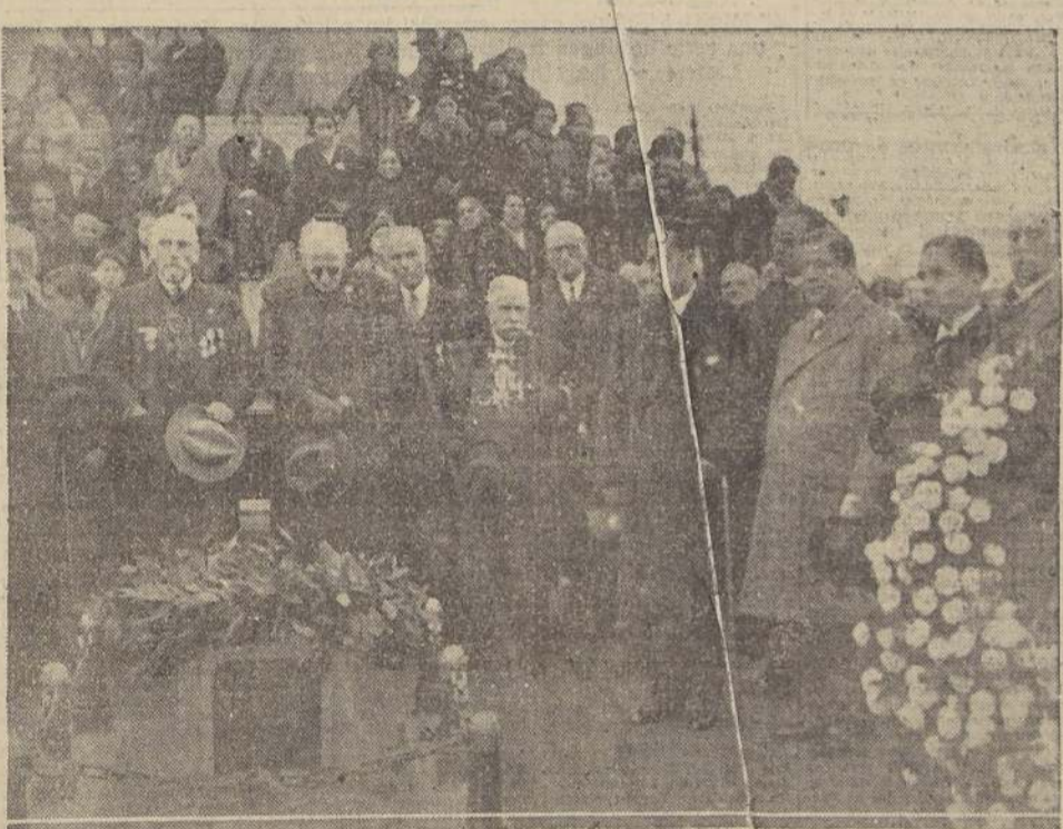
Durante el homenaje del Embajador de México al soldado chino