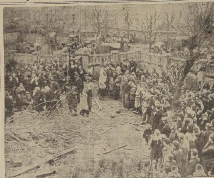
La población civil de la ciudad alemana de Erkelenz, acude a inscribirse en los registros ordenados por las autoridades militares aliadas

El punto más próximo alcanzado por los rusos que señala el comunicado de esta noche del alto comando soviético, es Bissau, 6,4 kilómetros al oeste, en tanto que despa-