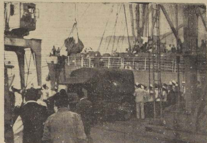
En un chingullo son desembarcados en Iquique algunos cadáveres llegados a bordo del "Alondra". Un camión del Ejército y fuerzas militares y navales, colaboran en la maniobra